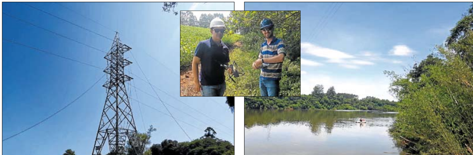
Subestação de Costão já fornece energia para a Certel desde janeiro

No dia 18 de janeiro, a Certel iniciou os procedimentos para o lançamento do segundo circuito da linha de 69 kV sobre o Rio Taquari, para conexão das suas subestações de Lajeado e de Canudos do Vale à nova subestação de Costão, em Estrela, que traz ao Vale do Taquari energia elétrica oriunda da Serra Gaúcha. A primeira etapa constituiu o lançamento, através de um drone, de uma linha da margem direita do rio até a margem esquerda.