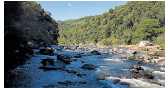
Nova hidrelétrica será instalada no Rio Forqueta

A quinta geradora se somará às já existentes, e que muito contribuem para que a Certel possa disponibilizar a melhor e mais acessível energia elétrica aos seus associados: Salto Forqueta (6,1 MW, no Rio Forqueta, entre Putinga e São José do Herval, inaugurada em 2002), Boa Vista (700 kW, no Arroio Boa Vista, em Linha Geraldo, Estrela, inaugurada em 2005), Rastro de Auto (7,02 MW, no Rio Forqueta, entre São José do Herval e Putinga, inaugurada em 2013) e Cazuzu Ferreira (9,1 MW, no Rio Lageado Grande, no Distrito de Cazuzu Ferreira, em São Francisco de Paula, inaugurada