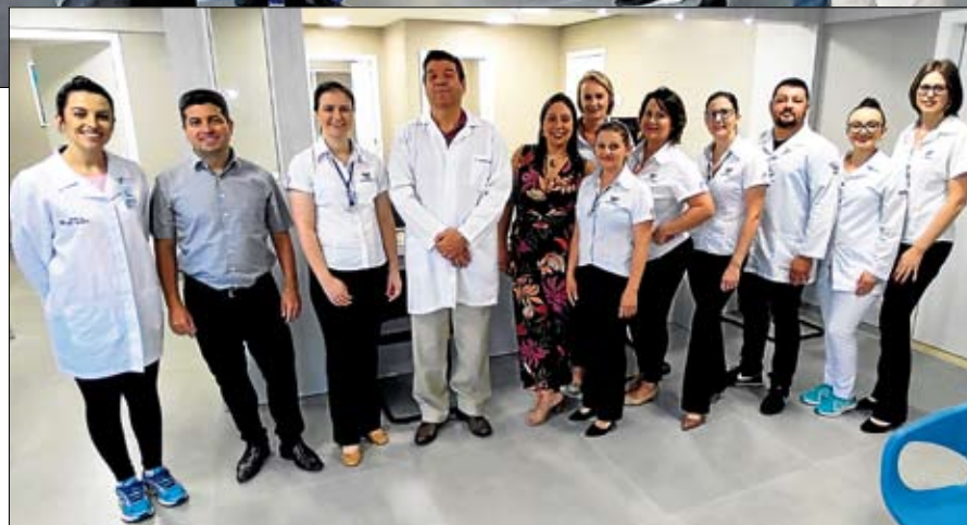
Equipe do setor conta com 22 profissionais

O equipamento possibilita exames de tomografia computadorizada de crânio, tórax, abdômen, coluna, pescoço, bacia, articulações, face, angiotomografias e tomografias com reconstrução 3D. O serviço oportuniza o máximo de detalhes na visualização de imagens, contribuindo para o tratamento e o maior conforto dos pacientes.