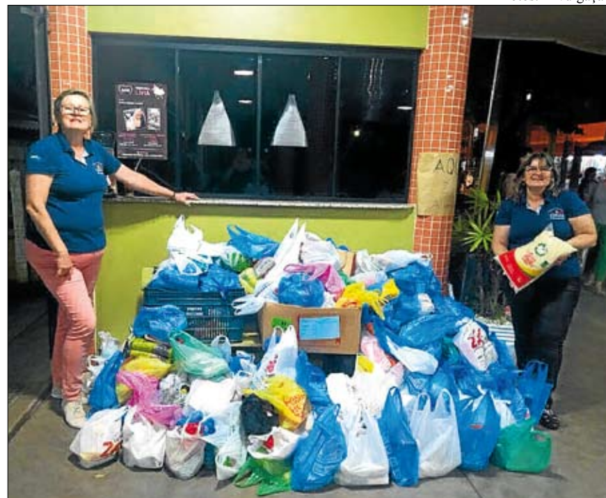
Campanha fez sucesso entre a comunidade e auxiliará famílias

O evento foi uma parceria entre Administração Municipal de Teutônia, Colégio Teutônia, por meio da Associação Cultural, Esportiva e Recreativa Teutoniense, Grupo Popular de Comunicação e Certel.