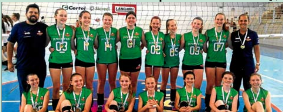
Time levou primeiro título em nível estadual

O voleibol da Juventus obteve ótimos resultados em 2019, apresentando um crescimento notório em seus resultados nos últimos dois anos, mostrando o investimento que vem sendo feito pelo clube. O ano foi encerrado com o primeiro título em nível estadual, onde a equipe mirim foi campeã da série prata do campeonato estadual organizado pela Federação Gaúcha de Voleibol. A Juventus tem patrocínio das cooperativas Certel, Languiru e Sicredi.