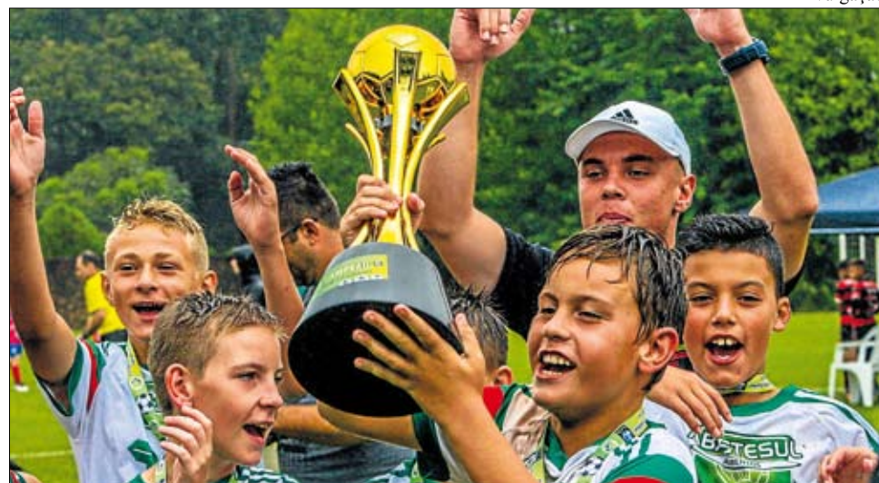
Com muita alegria, jogadores comemoram mais uma conquista