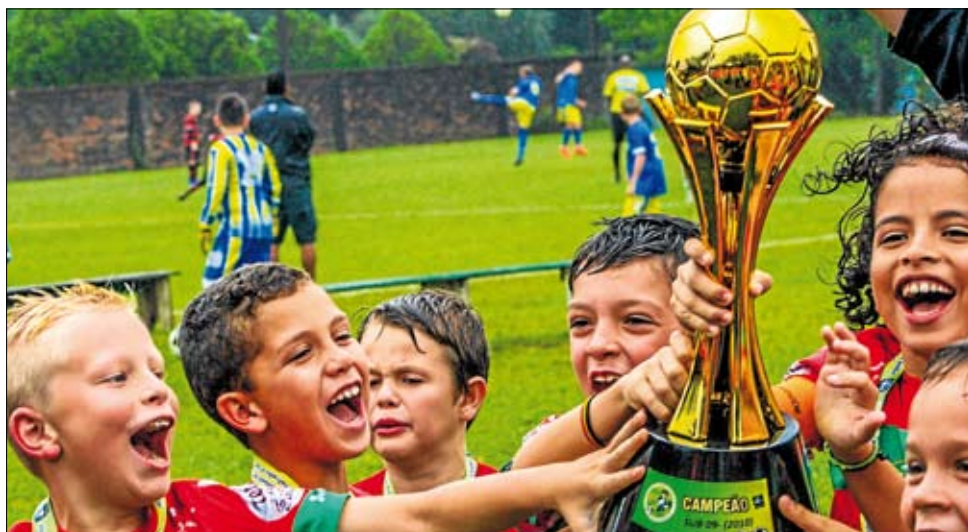
Jovens talentos levantaram a taça na competição