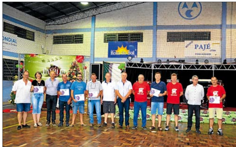
Funcionários receberam homenagem pelos 25 anos de Certel

B oa parte dos personagens que ajudam a construir a história de sucesso da Certel esteve reunida, no dia 21 de dezembro, na festa de final de ano promovida pela cooperativa. Colaboradores das variadas atividades da Certel, juntamente com familiares, estiveram presentes na comemoração, que também foi alusiva ao Natal, junto ao ginásio da Associação Atlética Certel.