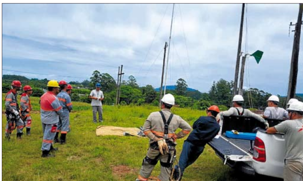
Curso proporcionou maiores conhecimentos referentes à rede compacta