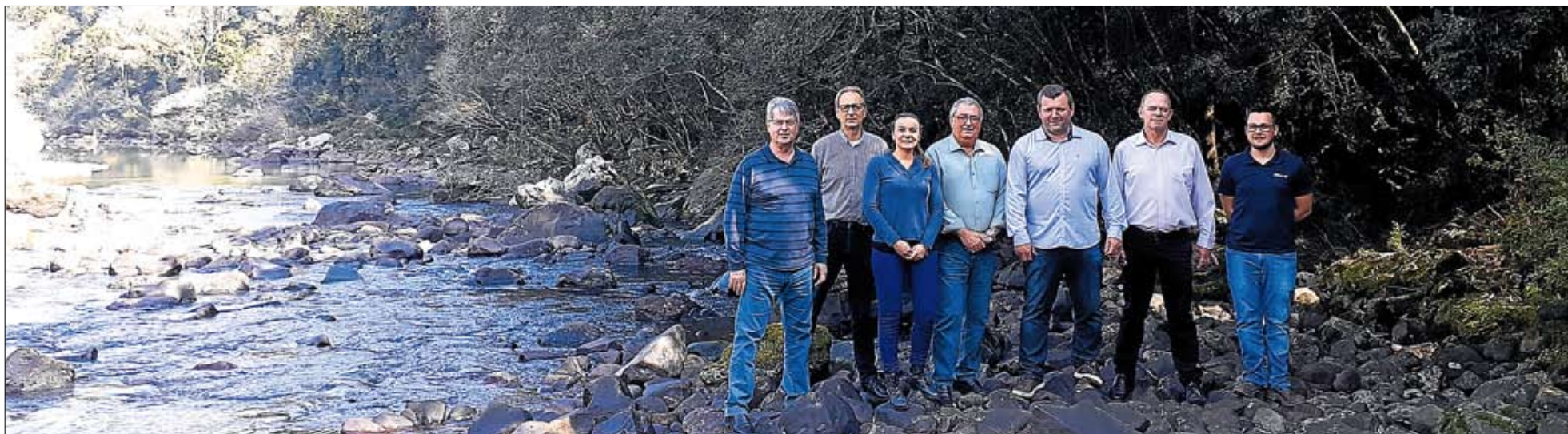
Quinta hidrelétrica da cooperativa será construída no Rio Forqueta, entre Pouso Novo e Coqueiro Baixo. Página 3