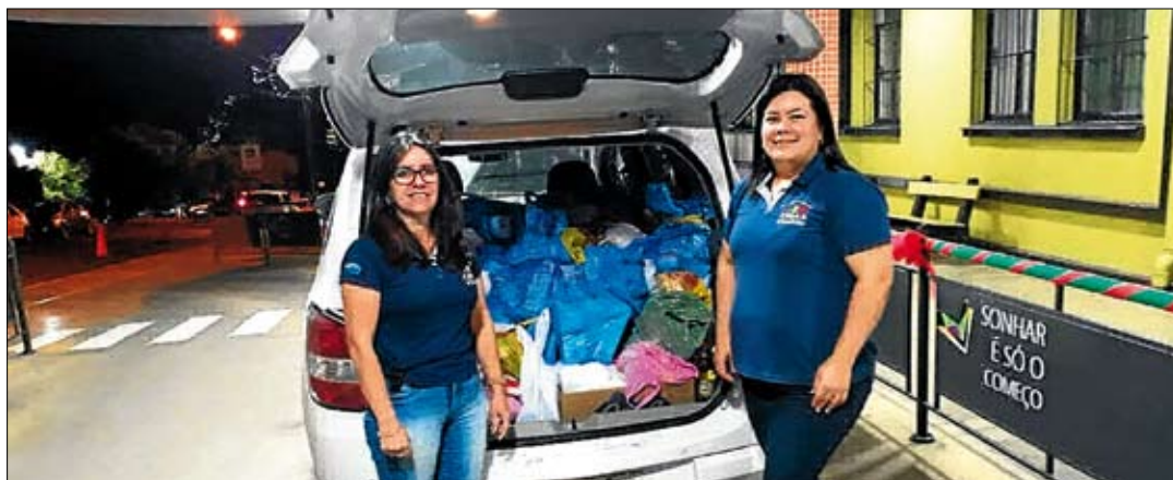
No primeiro dia de evento foram arrecadados cerca de 1,5 tonelada de alimentos

A lém da magia do Natal, que tomou conta do Parque Poliesportivo de Teutônia em dezembro, por meio da Campanha Um Sonho de Natal, um outro grande benefício social gerou-se com a iniciativa. Recentemente, os alimentos não perecíveis angariados pela campanha foram doados ao Centro de Referência de Assistência Social (Cras) de Teutônia.