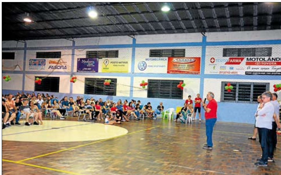
Presidente enalteceu a importância dos colaboradores