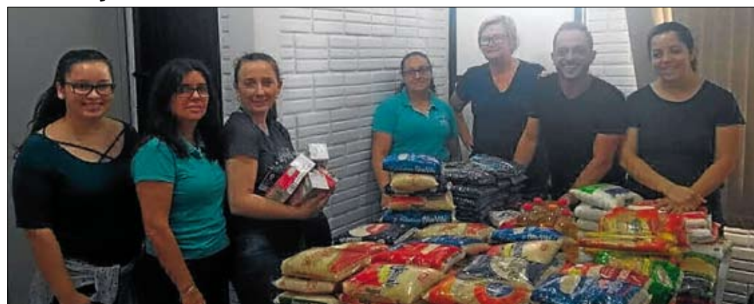
Alimentos não perecíveis foram doados ao Cras de Teutônia. Página 6

Sonho de Natal transformou doação de alimentos em realidade