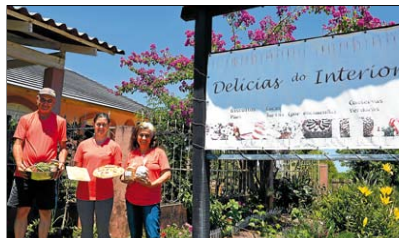
Energia contribui para sucesso de agroindústria. Página 5

O desafio de crescer através da agroindustrialização