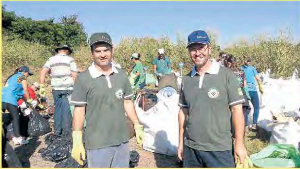
Certel e Certel Energia participaram da ação

Seis municípios integraram-se, no dia 11 de abril, à nona edição da ação ambiental Viva o Taquari Vivo, que retirou lixo das margens e do leito do rio Taquari, principal recurso hídrico da região que, inclusive, carrega o seu nome. Com aproximadamente 600 voluntários distribuídos em Estrela, Lajeado, Arroio do Meio, Cruzeiro do Sul, Bom Retiro do Sul e Venâncio Aires, foram coletados 4.711 quilos de resíduos, dos mais variados gêneros.