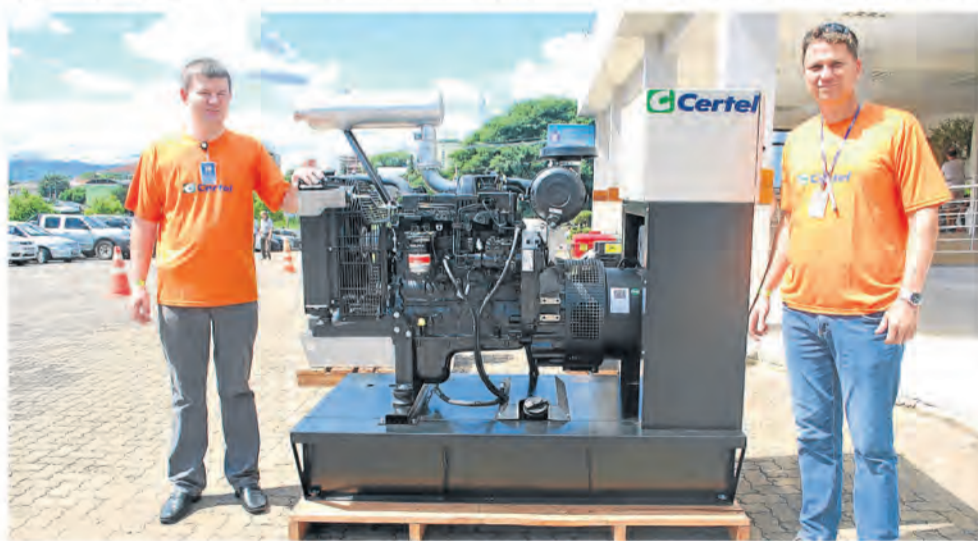
Geradores estiveram expostos na última assembleia da Certel

Para adquirir, há a opção de financiamento pelo Finame/BNDES e programa Mais Alimentos, podendo ser realizado em instituições financeiras como o Sicredi, ou ainda na própria Certel. Interessados podem entrar em contato com os telefones (51) 9328-4860, 9341-5731 e 0800 722 0505, WhatsApp 9288-7463 ou pelo endereço eletrônico www.lojascertel.com.br .