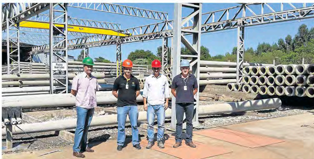
Profissionais da Celesc conheceram toda a estrutura da indústria de artefatos de cimento

Em abril, a Centrais Elétricas de Santa Catarina S.A. (Celesc) conheceu e homologou a fabricação de postes da Certel Artefatos de Cimento, localizada no Distrito Industrial de Teutônia. Desta forma, agora a indústria está habilitada a fornecer postes de concreto também para a concessionária catarinense, ampliando ainda mais a sua área de atuação que, atualmente, engloba o mercado gaúcho de energia elétrica.