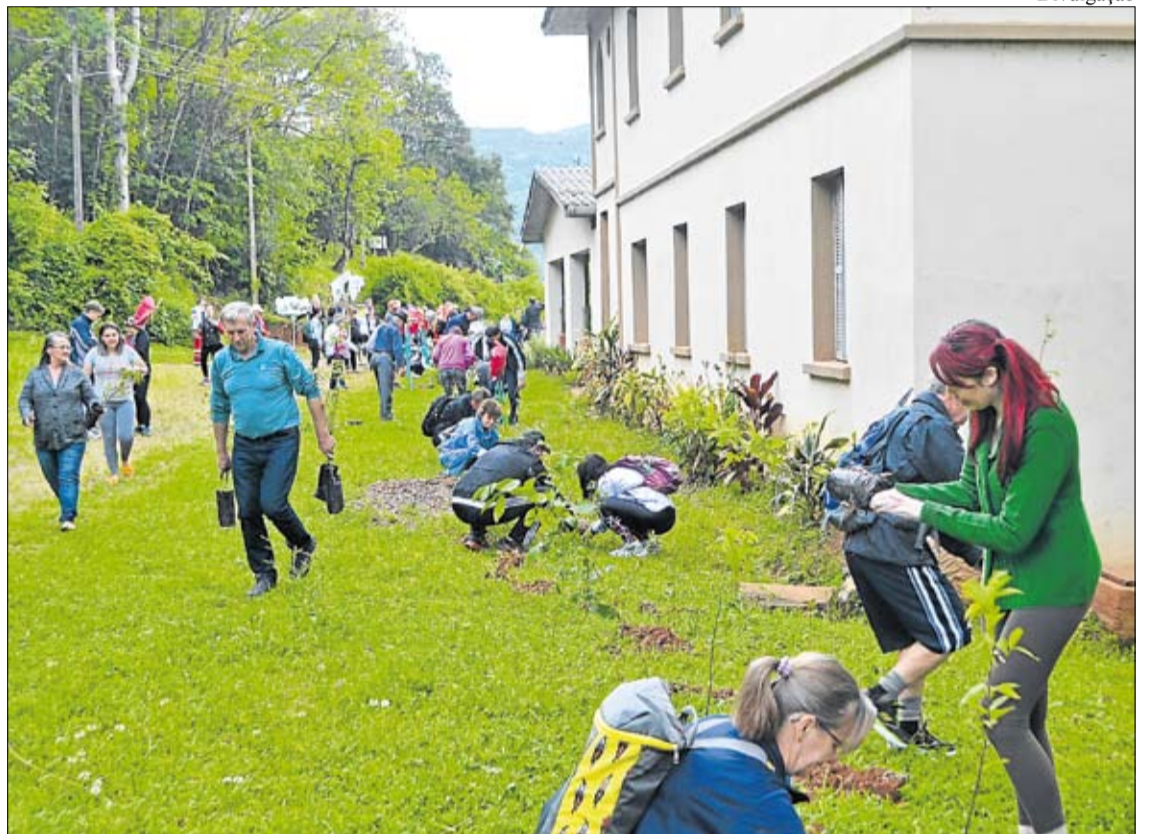
Plantio de mudas durante caminhada em Bela Vista do Fão, Marques de Souza