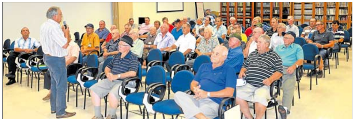
Reunião com líderes de núcleo da microrregião de Teutônia

tocante à geração, citou a obra da Hidrelétrica Rastro de Auto, no rio Forqueta, cujo orçamento inicial previsto era de R$ 34 milhões, mas que foi acrescido em mais R$ 21 milhões. Estes fatos originaram a necessidade de empréstimos bancários nos últimos anos, cujo acúmulo de juros contribuiu significativamente para avolumar o déficit de R$ 53 milhões desta cooperativa em 2016. “É uma dívida que está diminuindo gradativamente, haja vista que, em 2012, era de R$ 136 milhões. Paralelamente à captação da cota capital, diversas outras ações foram e continuam sendo tomadas no intuito de acabarmos com esta dívida”, salientou, observando que é comum as empresas cooperativas proporem o aumento da cota capital aos associados. “Até o momento, nunca havíamos necessitado propor esta captação, mas o momento chegou”, acrescentou.