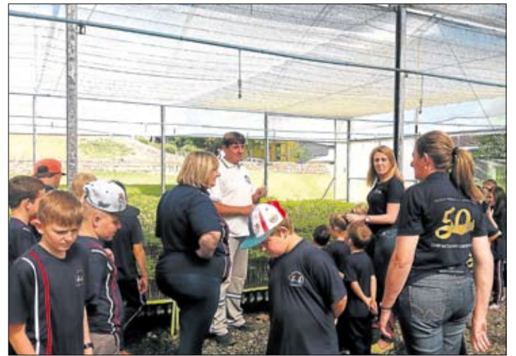
Visita ao Viveiro de Essências Florestais da cooperativa