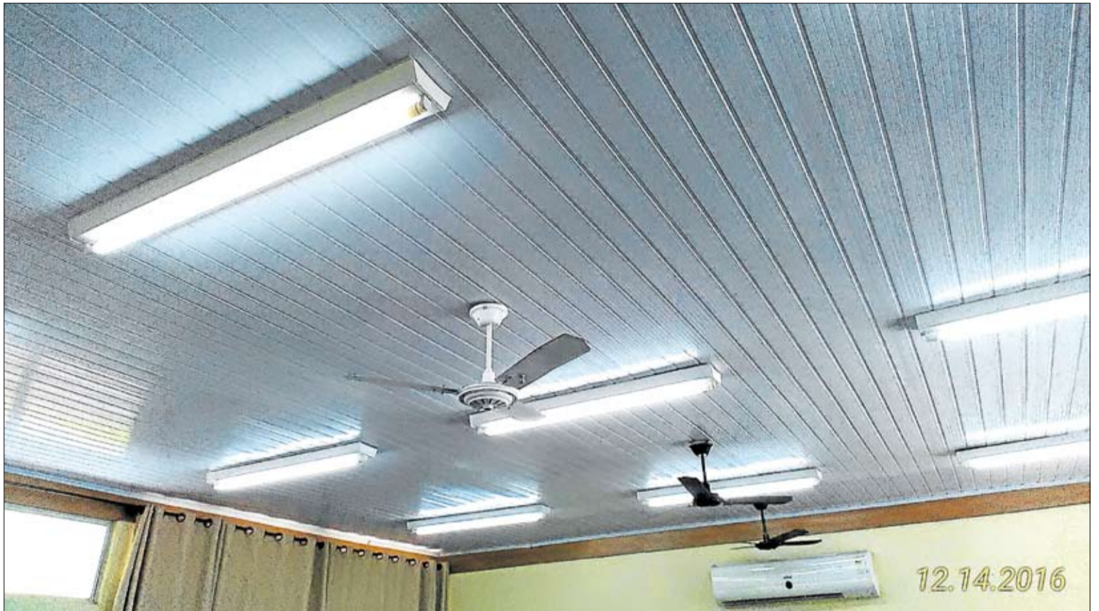
Substituição de lâmpadas na Escola Gomes Freire de Andrade, de Teutônia

EEEF Pedro Scherer, EMEF Porto Novo, EMEF Lauro Mathias Müller, EMEF Vida Nova, EMEF Nova Viena, EMEF Universitário, EMEF Guido