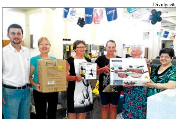
Entrega ocorreu na Loja Certel de Marques de Souza

Quem ainda não foi visitado para solicitar a alteração da doação pode dirigir-se à Loja Certel de Marques de Souza ou à Secretaria do hospital.