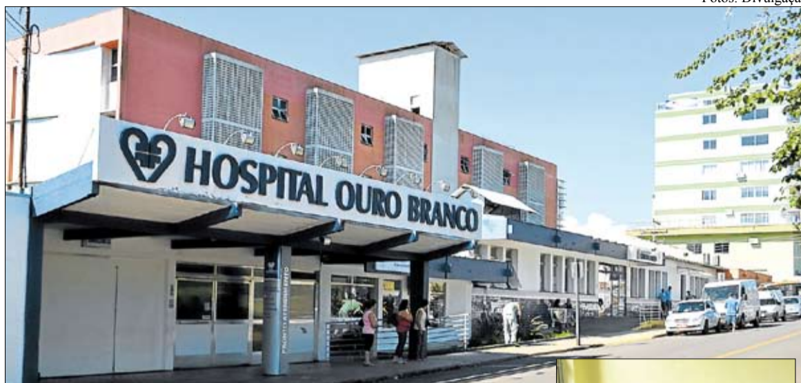
Hospital de Teutônia recebeu mais de R$ 99 mil em 2016

1.094 contribuições); o Corpo de Bombeiros Voluntários de Teutônia (R$ 26.945,00, com 3.816 contribuições); e o Corpo de Bombeiros Voluntários de Salvador do Sul e São Pedro da Serra (R$ 19.010,00, com 4.243 contribuições).