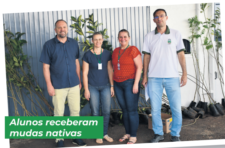
Alunos receberam mudas nativas

No dia 21 de setembro, o projeto Leopoldo Klepker Sustentável (LKS) mais uma vez demonstrou seu impacto positivo na conscientização ambiental e na promoção da sustentabilidade. O evento de destaque do dia foi a distribuição de 350 mudas de árvores nativas, em uma ação que contou com a participação ativa e engajada de estudantes da escola. A iniciativa, realizada em parceria com o Viveiro de Mudas da Certel, foi um sucesso notável, com os estudantes demonstrando um grande interesse em contribuir para o meio ambiente.