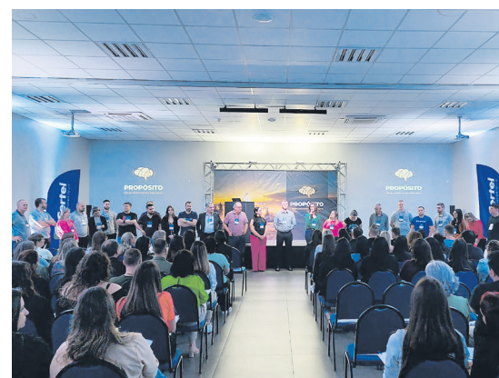
Evento destacou o plano de metas para os próximos quatro meses