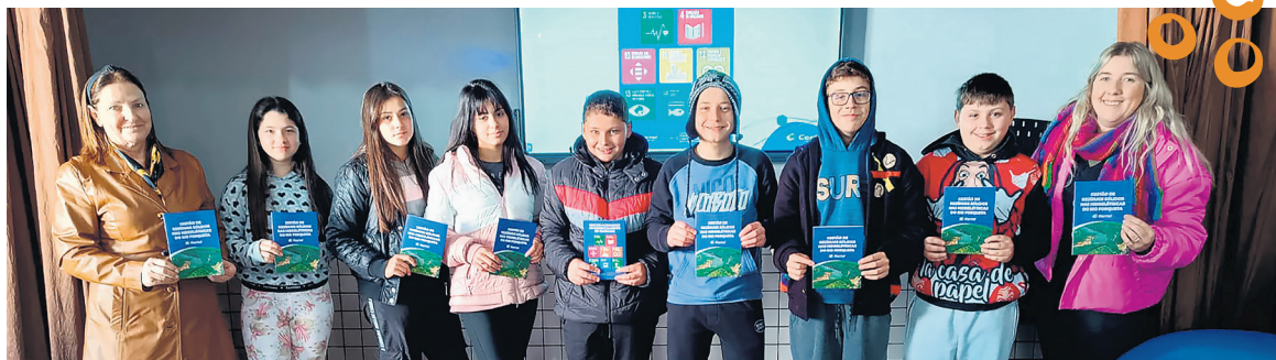
Emef Tomé de Souza, de São José do Herval

Fortalecendo a educação ambiental nas escolas, recentemente a Certel realizou palestras nos municípios de Putinga e São José do Herval. A ação promoveu a realização de quatro encontros em cada escola, destacando temas como “A água no Rio Forqueta”, “Fauna associada ao Rio Forqueta”, “Gestão de resíduos nas PCHs” e “Flora nas áreas de preservação permanente e legislação ambiental”.