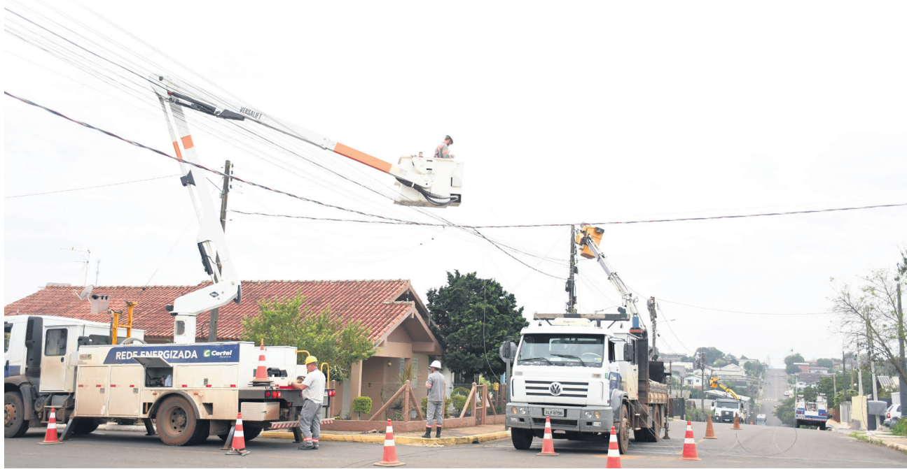
Equipes atuando em Teutônia, onde melhorias ampliam a qualidade do atendimento

Foram instalados novos postes, rede elétrica e transformadores nos dois projetos