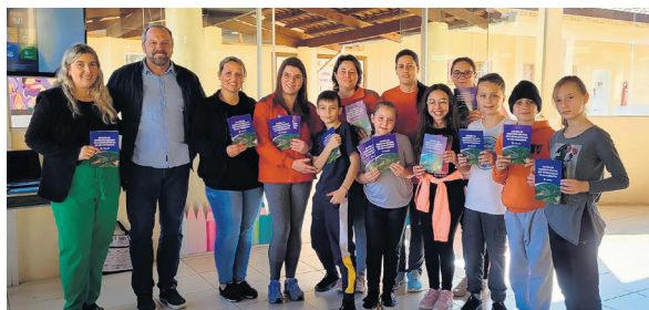
Emef Anita Garibaldi, de Putinga

Após a conclusão dos eventos nas escolas, os alunos têm a oportunidade de realizar visitas técnicas a qualquer uma das hidrelétricas da Certel, acompanhados por profissionais especializados. “Essa experiência prática contribui significativamente para a compreensão dos conceitos discutidos nas palestras e para o desenvolvimento de uma consciência ambiental mais sólida entre os estudantes”, finaliza Jasper.