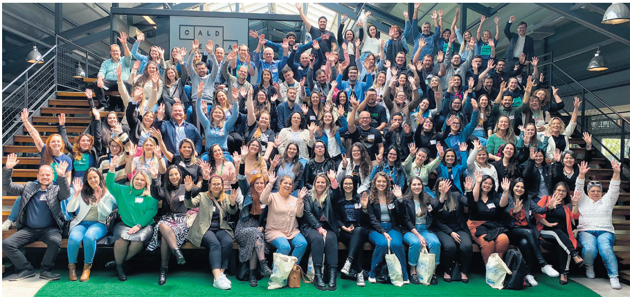
Mais de 100 comunicadores estiveram presentes

Profissionais da comunicação cooperativista buscaram novos conhecimentos no mercado de marketing digital e trade marketing