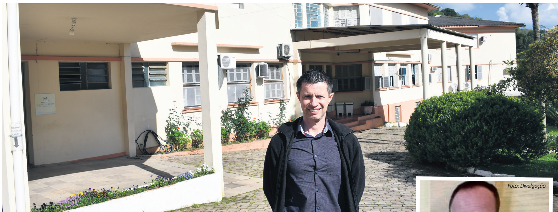
Hospital possui 101 anos de história

O hospital também é referência em atendimentos emergenciais e saúde mental