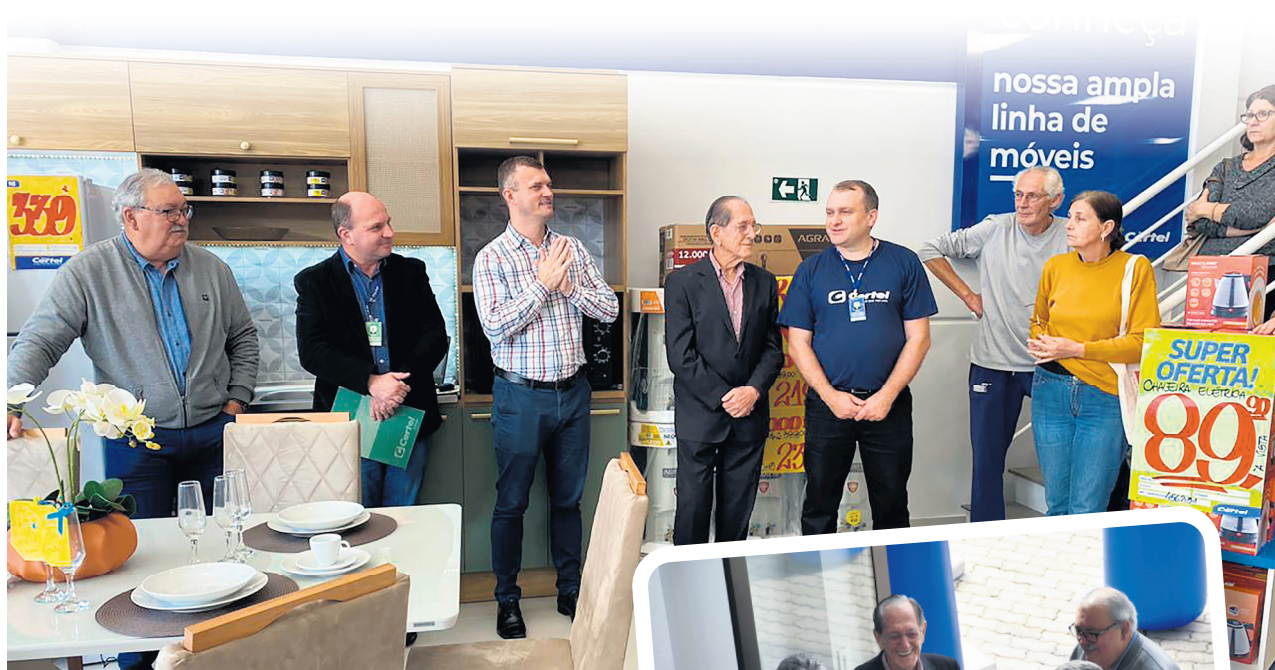
Loja conta com todas as soluções da Cooperativa

Inauguração contou com a presença de associados, clientes, lideranças, fornecedores, diretores, gestores e funcionários