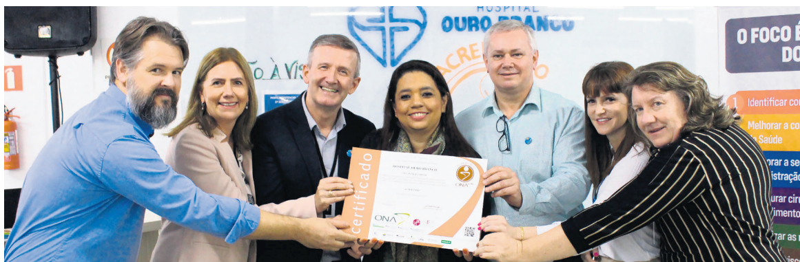
HOB é o primeiro hospital de média complexidade do Vale do Taquari a receber a certificação

Métodos de avaliação da Acreditação ONA são mundialmente reconhecidos