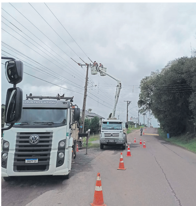
Dois quilômetros de rede trifásica foram instalados em São Pedro da Serra

Os dois projetos contaram com a força de trabalho de 80 funcionários, que atuaram inclusive em método de linha viva, possibilitando que os associados ficassem sem energia elétrica pelo menor tempo possível.