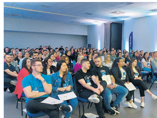
Participaram gerentes das 38 lojas e demais funcionários da Cooperativa