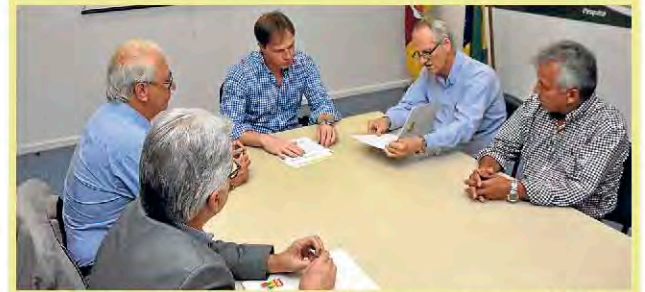
Redecker reuniu-se com lideranças cooperativistas

Em mais uma das audiências que a Organização das Cooperativas do Rio Grande do Sul tem realizado com os novos secretários de Estado, a Ocergs esteve, no dia 4 de março, na sede da secretaria estadual de Minas e Energia, quando dirigentes do setor foram recebidos pelo titular da pasta, deputado Lucas Redecker. Uma das pautas do encontro foi a disponibilização de linhas de crédito por parte do governo estadual para produtores rurais, visando a transformação de energia elétrica monofásica em redes bifásicas ou trifásicas. Participaram da reunião o presidente do Sistema Ocergs-Sescoop/RS, Vergílio Perius, os diretores da Ocergs, Paulo Pires e Jânio Stefanello, e o superintendente da Fecoergs, José Zordan.