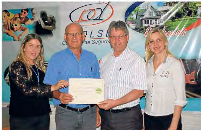
Poolseg Corretora de Seguros