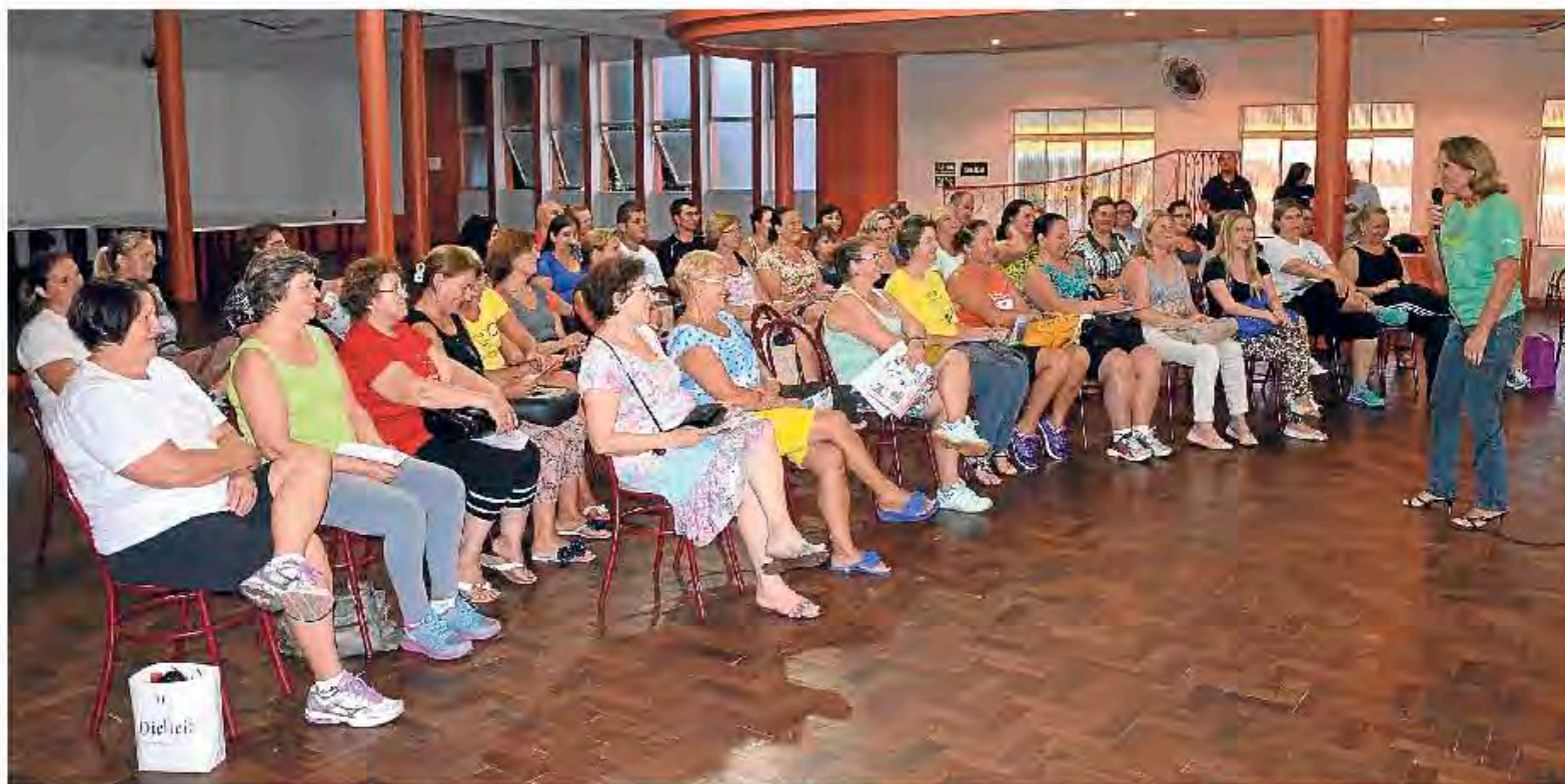
Programa é desenvolvido em Estrela (foto) e Teutônia, com foco à saúde e ao bem-estar. Página 3