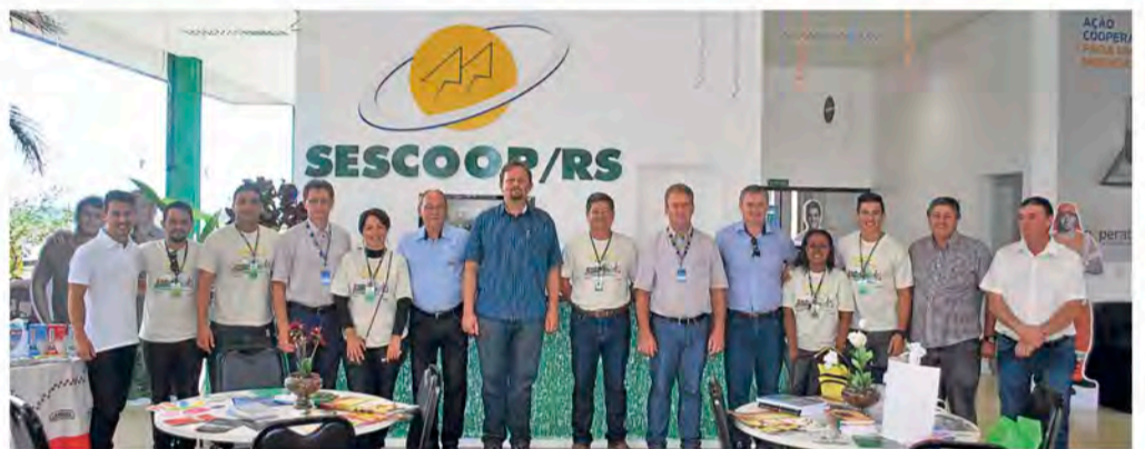
No Mundo Cooperativo Gaúcho, cooperativas divulgaram os seus serviços