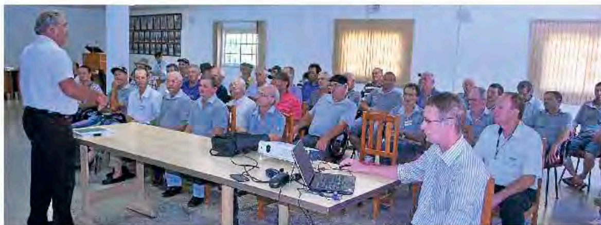
Reunião com lideranças da microrregião de Progresso. Página 4