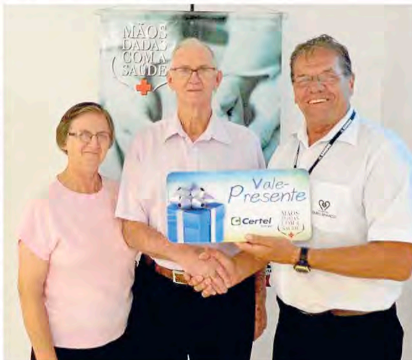
Koefender (c) e sua esposa recebendo a premiação

Para saber mais, contate a recepção do HOB pelo fone (51) 3762-1222 ou diretamente com a Certel Energia, pelo 0800 516300.