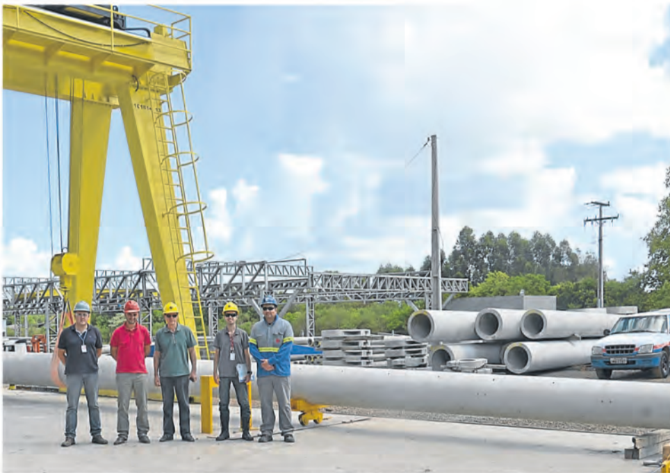
CEEE avaliou postes de linha de transmissão

Localizada no Distrito Industrial de Teutônia, a Certel Artefatos de Cimento incluiu mais uma importante empresa em seu rol de clientes. Trata-se da Companhia Estadual de Energia Elétrica (CEEE), que passará a adquirir postes de concreto da indústria.