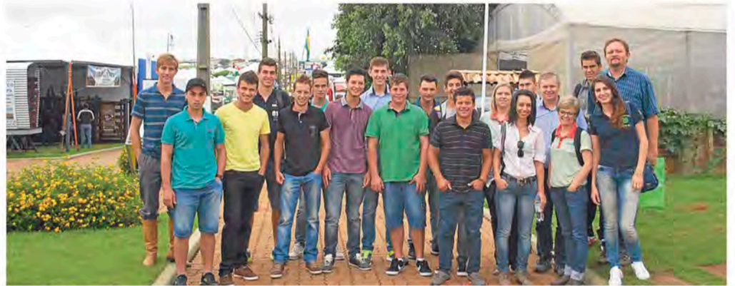
Estudantes acompanharam as tendências do mercado agrícola para os próximos anos

A visita técnica também foi útil para a divulgação da 9ª edição do Fórum Tecnológico do Leite e 5ª edição da Feira Agrocomercial do Colégio Teutônia, previstas para ocorrerem em setembro. Além de acompanharem os estudantes, os professores aproveitaram para entrar em contato com as empresas a fim de disponibilizar o espaço de exposição do evento, que reunirá centenas de produtores e profissionais da cadeia produtiva do leite do Rio Grande do Sul.