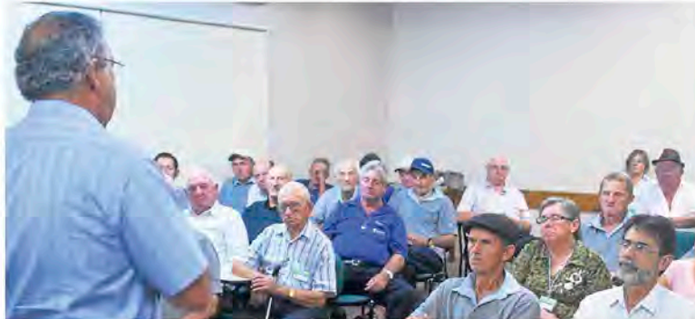
Salvador do Sul