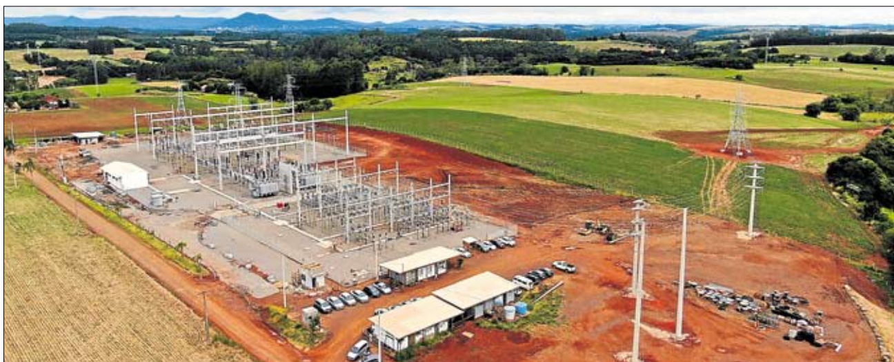
Cooperativa será beneficiada pela nova subestação, com energia elétrica oriunda da Serra Gaúcha

O Vale do Taquari está sendo contemplado com mais uma fonte de energia elétrica para o abastecimento da região. Entrou em operação, no final de dezembro, uma linha de transmissão, na tensão de 230 kV, que interliga as subestações de Garibaldi à subestação localizada em Costão, no município de Estrela (subestação Lajeado 3), onde somente a Certel será conectada para suprir toda sua carga. Esta subestação será interligada com a subestação Lajeado 2, em funcionamento.