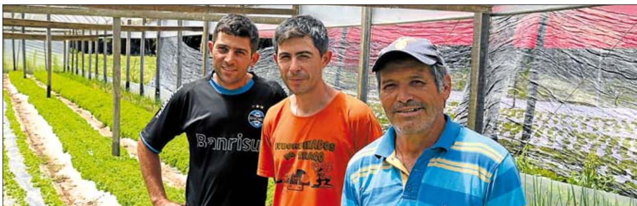
Produtores destacam a importância da cooperativa para o desenvolvimento do setor. Página 4