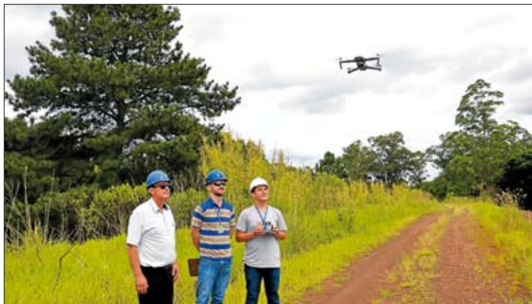
Drone auxilia na inspeção das redes elétricas

“Onde antes precisávamos de um profissional altamente treinado e equipado com EPI’s para chegar muito próximo de uma rede energizada, através de escadas, cintos e cordas, agora poderemos usar o drone numa operação muito mais breve e segura, economizando os recursos da cooperativa e expondo