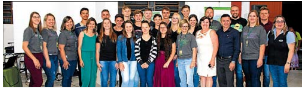
Jovens celebram a fundação da cooperativa

No dia 06 de dezembro, aconteceu a Assembleia de Fundação da Coopeasp – Cooperativa Escolar dos Aprendizes de São Pedro da Serra.