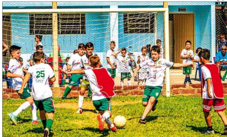
Momento de integração entre os jovens