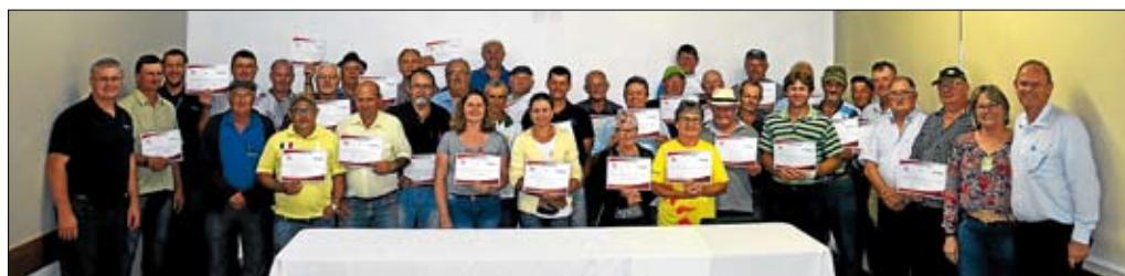
Salvador do Sul

A direção da Certel reuniu-se, no início de dezembro, com os delegados e suplentes das suas microrregiões. Os encontros ocorreram em Salvador do Sul, Marques de Souza, Lajeado, Progresso e Teutônia. O objetivo foi inteirar os representantes dos associados sobre o desempenho da cooperativa em 2019, além de estimar os investimentos para 2020.