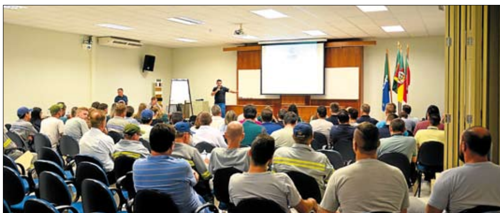
Colaboradores atentos à palestra de segurança do trabalho