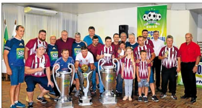
Equipe recebeu taça em cerimônia de encerramento. Página 8