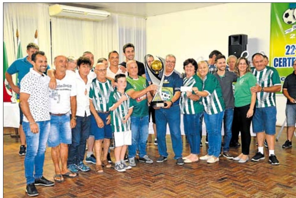
União de Palmas (Encantado), campeão da categoria Veteranos

O Clube dos 15, em Lajeado, esteve lotado na noite do dia 17 de dezembro, durante cerimônia de encerramento da 22ª Copa Certel/Sicredi/Aslivata. Uma energia muito forte contagiou atletas, dirigentes, árbitros, lideranças regionais, patrocinadores e imprensa, evidenciando a função social exercida pelo campeonato.