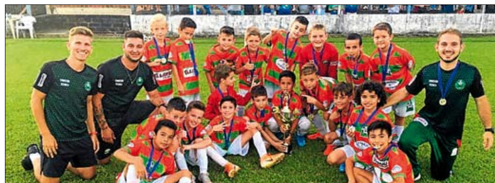
Jogadores comemoram vitória com a taça