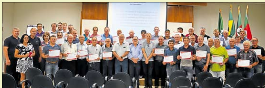
Representantes receberam certificação de curso sobre governança. Página 5