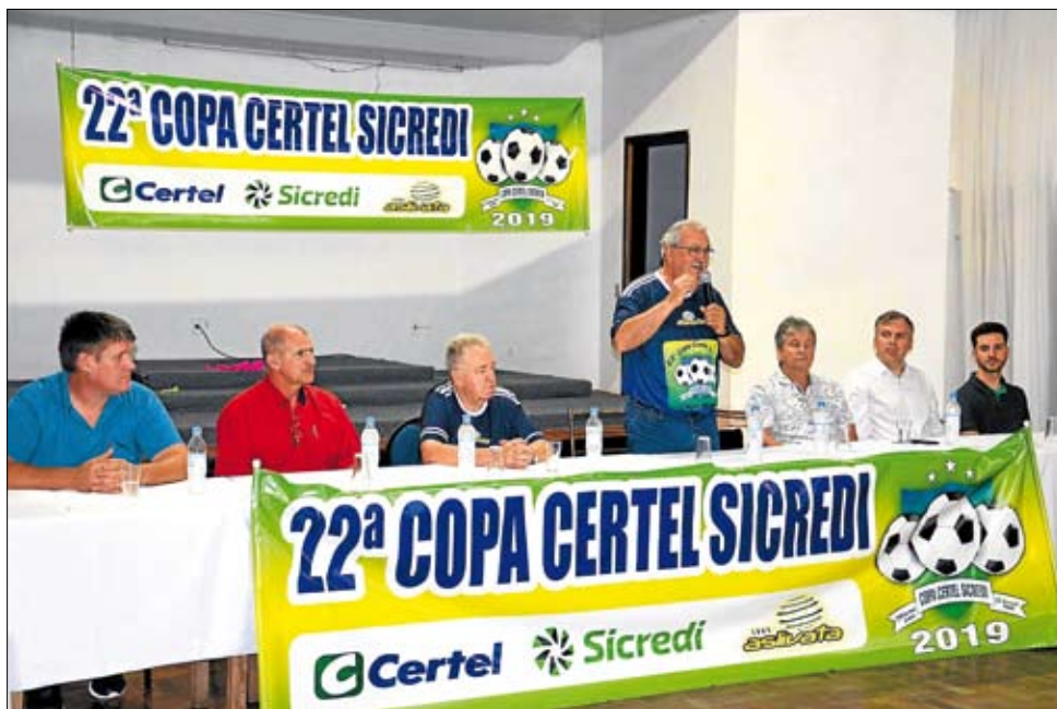
Hennemann enalteceu a importância do campeonato