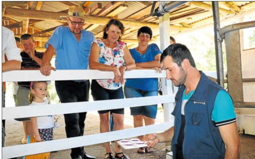
Reunião orientou bovinocultores de leite

Com o objetivo de discutir os novos critérios para a produção de leite de qualidade – a partir do que determinam as instruções normativas N os 76 e 77 –, a Emater/RS-Ascar e a Secretaria de Agricultura de Poço das Antas realizaram no dia 29/11 uma reunião técnica com bovinocultores de leite. A atividade ocorreu na propriedade da família Lermen, da localidade de Paris Baixo e contou com palestra e atividades práticas de limpeza e higiene na hora da ordenha, com detalhes dos protocolos de lavagem, e que estejam de acordo com a regulamentação que está em vigor desde junho de 2019.