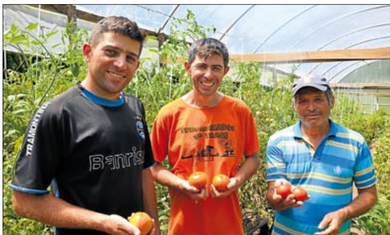
Família também investe na produção de verduras

Para todas as atividades desenvolvidas na propriedade, os Rosa necessitam de um fornecimento de energia confiável. “Nossos plantios são todos irrigados e, para que a água seja bombeada do nosso poço e chegue até a horta, dependemos da energia. Também na ordenha, no cercamento do rebanho e nos