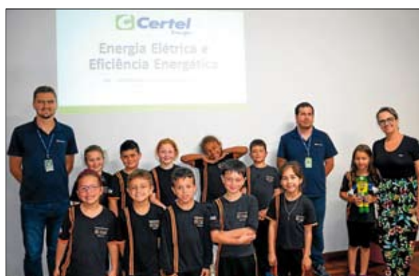
Alunos entusiasmados com a palestra