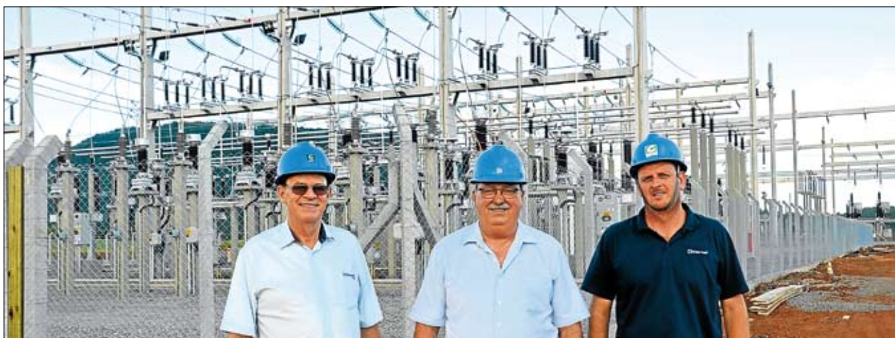
Cooperativa será a única conectada para suprir carga da linha de transmissão. Página 3