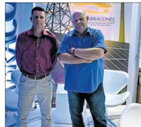
Representantes da Certel no evento

O encontro, que tem por objetivo promover a discussão de temas atuais e de interesse da classe contábil, visa proporcionar