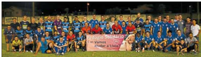
Juventude e Alto Taquari