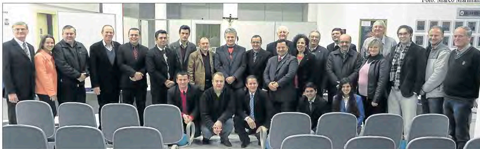
Expressão do cooperativismo de Teutônia foi enaltecida pelos vereadores

Celebrado em 4 de julho, o Dia Internacional do Cooperativismo foi homenageado em sessão solene da Câmara de Vereadores de Teutônia, no dia 23 do mesmo mês. O sistema esteve representado na ocasião por dirigentes das cooperativas Certel, Languiru, Sicredi e Comatra.