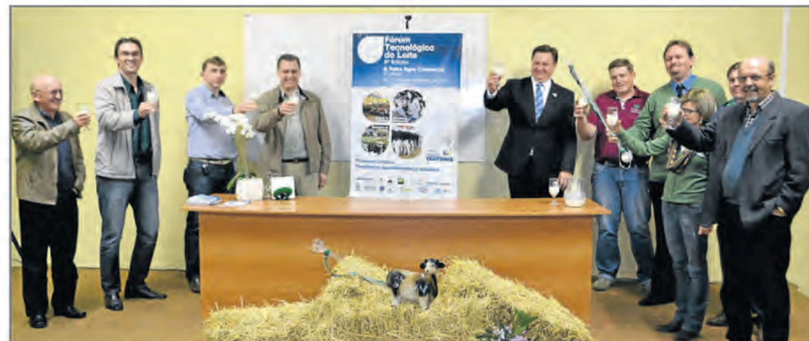
Brinde com a estrela principal do evento, o leite, marcou o lançamento oficial do fórum, que ocorre no período de 16 a 18 de setembro

O 9º Fórum Tecnológico do Leite é uma realização do Colégio Teutônia, com a parceria de Emater/RS-Ascar, Regional Sindical Vale do Taquari, Fetag/RS, Governo do Estado – Secretaria de Desenvolvimento Rural, Pesca e Cooperativismo, Associação dos Engenheiros Agrônomos do Vale do Taquari (Aseat), Centro de Apoio ao Pequeno Agricultor (Capa), Nutrifarma, Cooperativa Languiru, Certel Energia, Sicredi Ouro Branco, Du Pont Pioneer, Barrisul e prefeituras de Teutônia e Westfália.