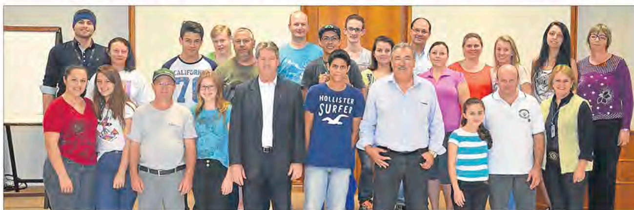
Aprendizes cooperativos e seus pais com direção e equipe de RH

O Programa Aprendiz Cooperativo é coordenado pelo Serviço Nacional de Aprendizagem do Cooperativismo (Sescoop) e proporciona condições necessárias para adequação à Lei 10.097/00 e ao Decreto 5.598/05. Além da questão legal, o principal objetivo do programa é preparar e inserir profissionalmente os jovens no cooperativismo.