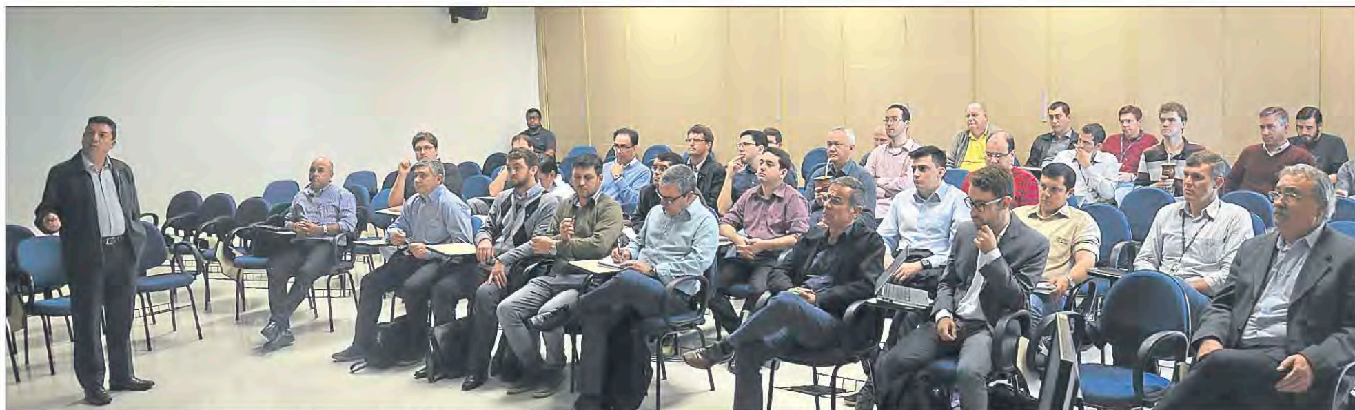
Cooperativas de energia de diferentes regiões do Estado reuniram-se no auditório da Certel e Certel Energia, em Teutônia

O novo estudo sobre a metodologia para revisão tarifária que a Agência Nacional de Energia Elétrica (Aneel) está propondo altera o modelo