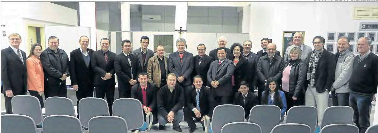
Lideranças destacaram a elevada performance do cooperativismo em prol do desenvolvimento social. Página 4