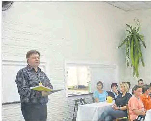
Rückert diz que educandário não quer somente educar, mas também cuidar da comunidade

Segundo o diretor, o convênio demonstra que o educandário não quer somente educar, mas também cuidar da comunidade. “É um olhar que vai um pouco além do fazer específico da educação no âmbito cognitivo, ou seja, de ensinar conteúdos, mas que está na dimensão da qualidade da vida que queremos gerar