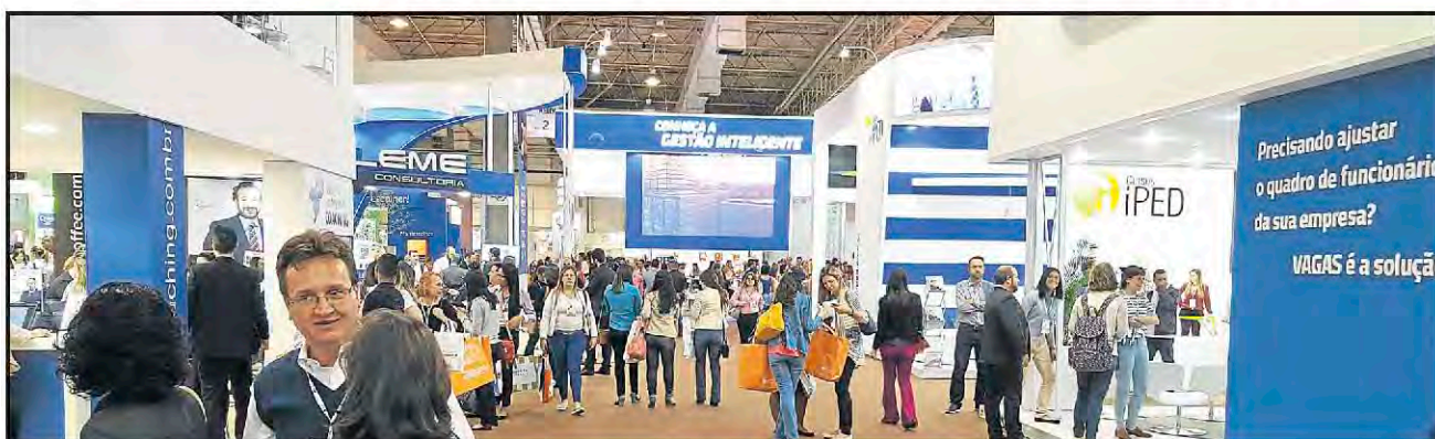
Congresso Nacional de Recursos Humanos ocorreu em São Paulo

A solução criativa encontrada pela Certel para agilizar o envio de documentos e informações ao Ministério do Trabalho e Emprego, atendendo ao eSocial, e que, no ano passado, premiou a Certel com o Prêmio Top Ser Humano 2014, concedido pela seccional gaúcha da Associação Brasileira de Recursos Humanos (ABRH-RS), agora classificou a cooperativa entre as finalistas deste ano do Prêmio Ser Humano Oswaldo Checchia, da ABRH Brasil, com o projeto “Para o eSocial, assuntos burocráticos e funcionais ainda são dever do RH, mas a gestão pode ser diferente, com estratégia