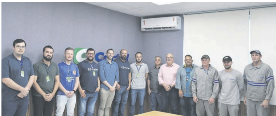
Funcionários e instrutor comemoraram formação com gestores e diretores

- atendimento a 240 mil ligações pelo Disque Certel Energia.