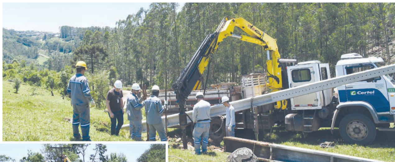
Toda força de trabalho da Certel esteve envolvida