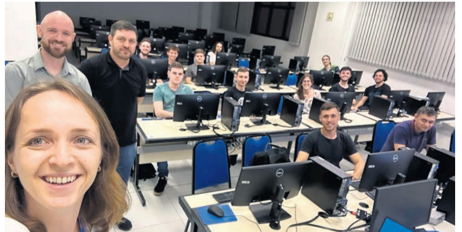
Participaram os cursos de graduação e técnicos

Para Thies, todos os assuntos foram ao encontro do principal objetivo das duas Cooperativas, que é manter um serviço de distribuição de energia seguro, confiável, acessível e eficiente. “Trocamos experiências sobre projetos de modernização, visando a concepção de redes inteligentes, como resposta à demanda, infraestrutura de medição avançada, automação de rede e recursos de energia. Essa oportunidade possibilitou que os alunos conhecessem de perto os principais recursos utilizados pelas Cooperativas no fornecimento de energia elétrica. Além de ser um momento conectado com a prática do ambiente corporativo”, finaliza.