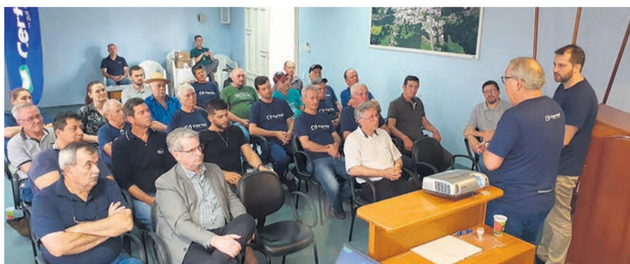
Boqueirão do Leão