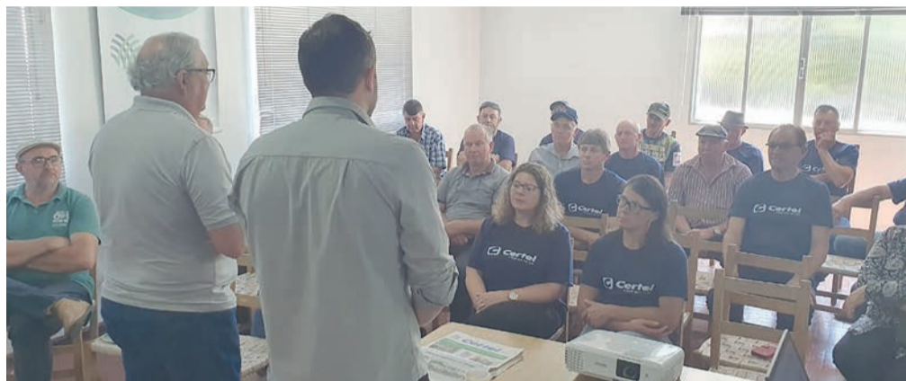
Salvador do Sul e Taquara