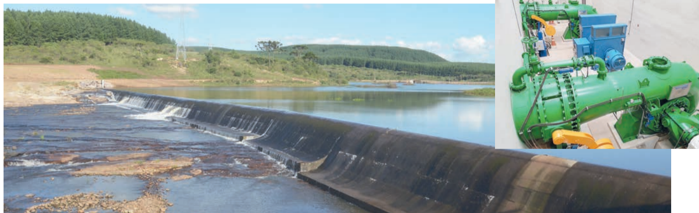
Hidrelétrica Cazuza Ferreira, em São Francisco de Paula, já gerou 31.542,513 MWh neste ano

Tanto a geração de energia elétrica quanto o fornecimento do insumo aos associados da Certel estão com um excelente desempenho em 2023. Nossos diretores observam estas grandezas que muito contribuem para o desenvolvimento e performance da Cooperativa.