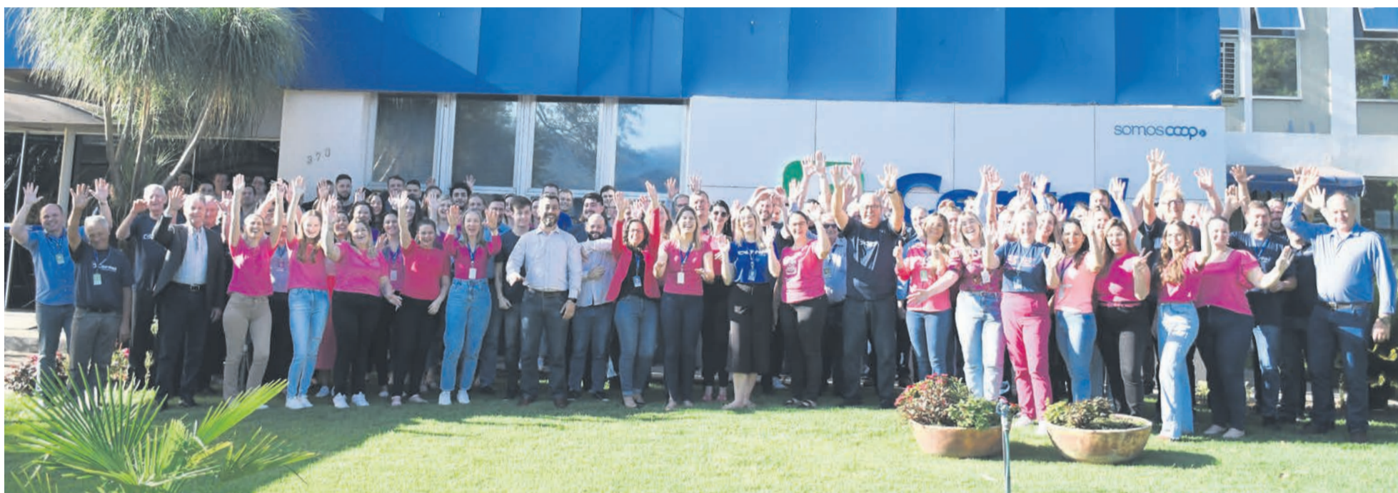
Profissionais da Certel em ação interna de conscientização ao Outubro Rosa e ao Novembro Azul

Meses reforçam a importância da prevenção e cuidado