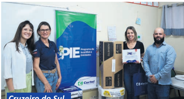
Cruzeiro do Sul

“É uma grande alegria ter a Certel aqui conosco. Ficamos muito gratos pela parceria nas doações. Adquirimos muitos itens que precisamos para a escola nas lojas Certel e sempre somos muito bem atendidos.”