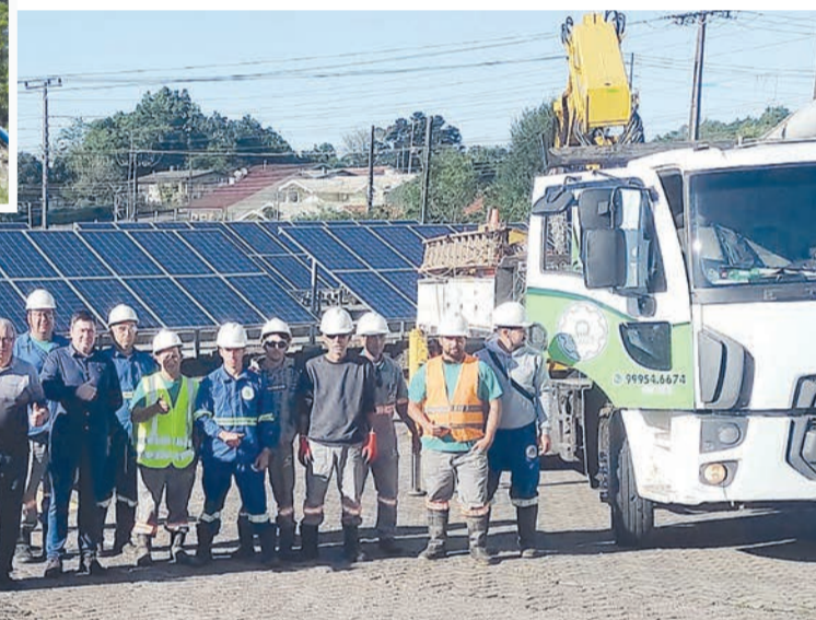
Profissionais da Certaja, de Taquari, contribuíram com os serviços

A tempestade e as chuvas da sexta-feira, dia 17 e do sábado, 18 de novembro, causaram um grande transtorno em diversas regiões do Estado. Além dos prejuízos de diversas ordens que foram causados, com danos em moradias e acessos, também o fornecimento de energia elétrica ficou prejudicado.