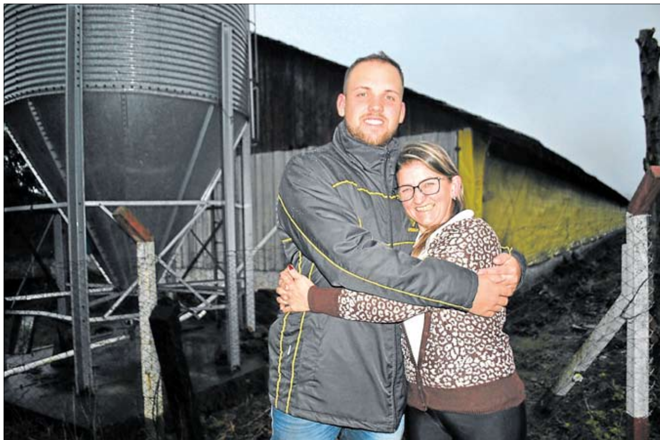
Mãe e filho seguem determinados a evoluir no agronegócio. Página 7