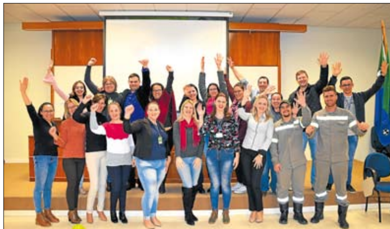
Profissionais e instrutores vibraram ao final do curso

Profissionais da Certel tiveram, nos dias 10 e 11 de julho, um treinamento sobre atendimento humanizado, com instrutores da P & O Desenvolvimento Humano, de Canoas. A iniciativa visa à melhoria gradativa da qualidade no atendimento ao quadro social e se enquadra com o Planejamento Estratégico e com os preceitos da certificação de qualidade ISO 9001 da Certel.