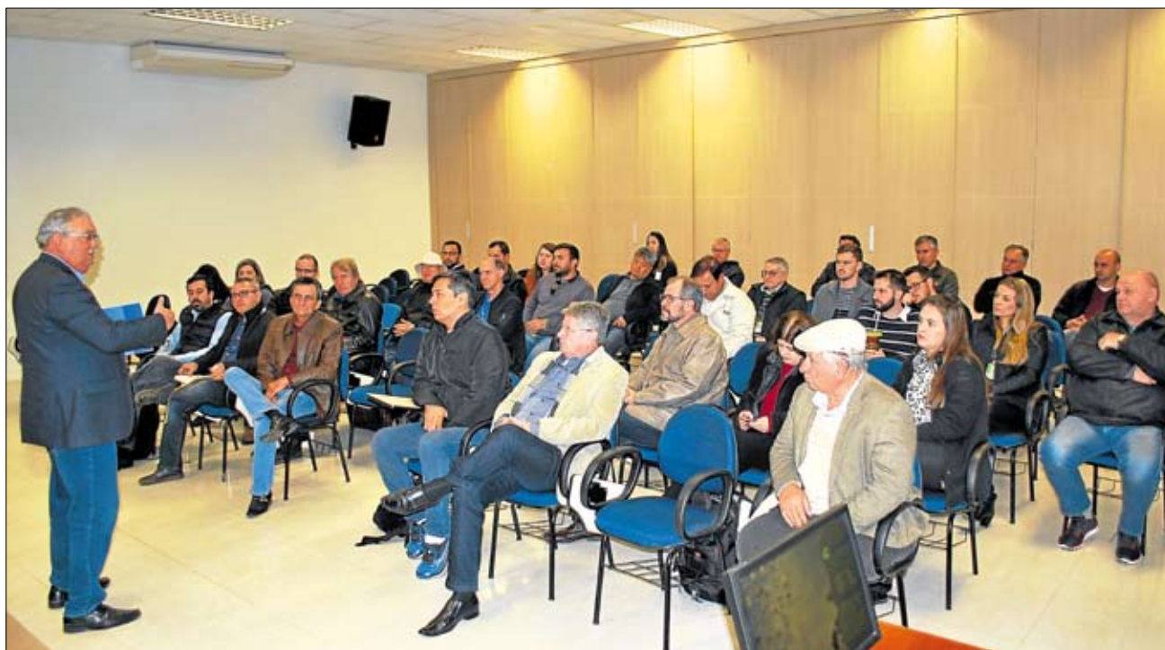
Hennemann frisou importância da cooperativa para o desenvolvimento regional. Página 8

Casal de agricultores é fiel ao cooperativismo