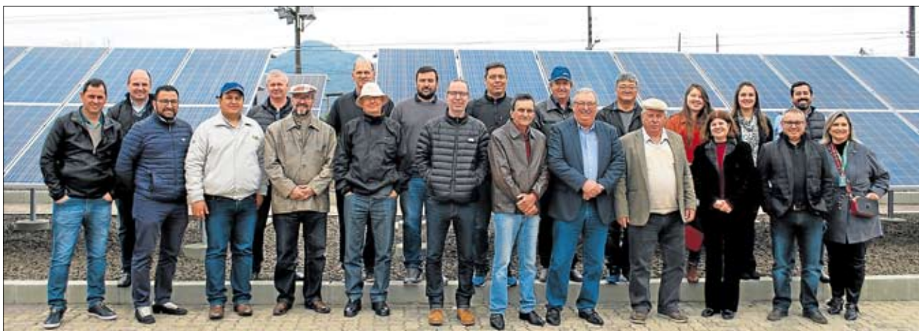
Visita à Usina Solar, instalada na sede administrativa da cooperativa, em Teutônia

O grupo conheceu a Usina Solar e o Centro de Operações do Sistema Elétrico, junto à sede, bem como