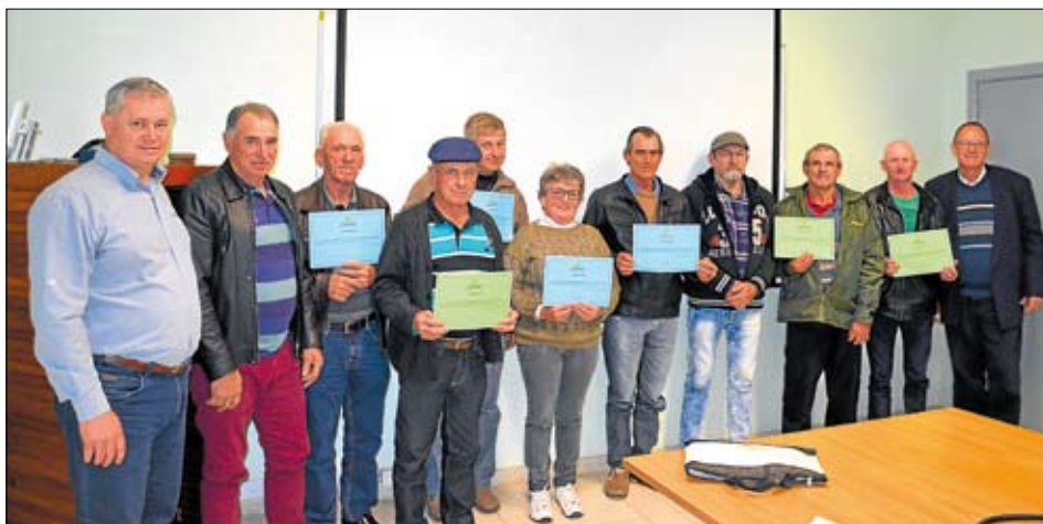
Conselheiros foram certificados pelo Sescop-RS

Os conselheiros fiscais da Certel concluíram um curso de capacitação promovido pelo Serviço Nacional de Aprendizagem do Cooperativismo (Sescop-RS). A entrega dos certificados ocorreu em recente reunião na sede da cooperativa.