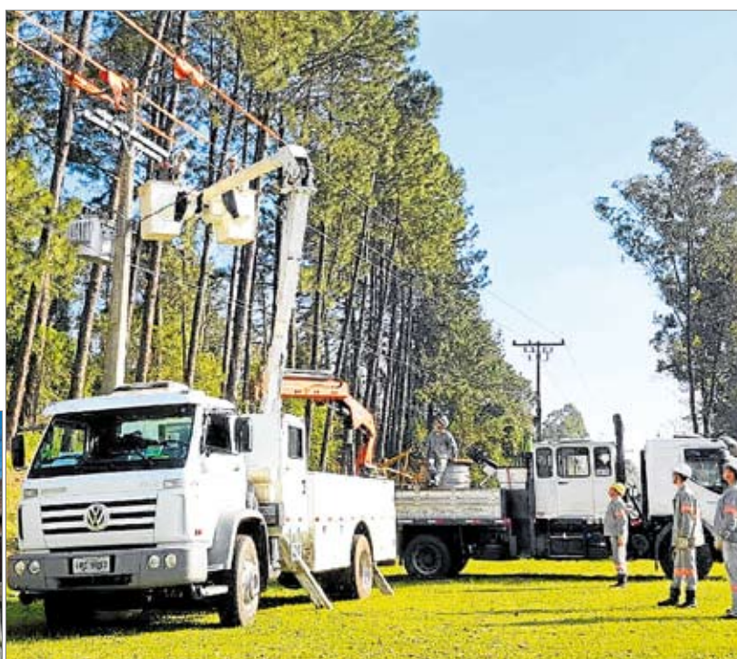
Maioria dos serviços são realizados com redes energizadas

A Certel está finalizando o oitavo alimentador, com rede compacta ou ecológica, no município de Teutônia, o qual irá atender parte do Bairro Languiru e a totalidade do Bairro Alesgut. Para realizar esta obra, que está no Planejamento Estratégico da Certel, a cooperativa disponibilizou equipes de construção de rede e de linha viva (para rede energizada), de projetos, de engenharia e de supervisão. Destaque ao fato de que aconteceram pequenos desligamentos, ou seja, a maioria dos serviços estão sendo realizados com as redes energizadas.