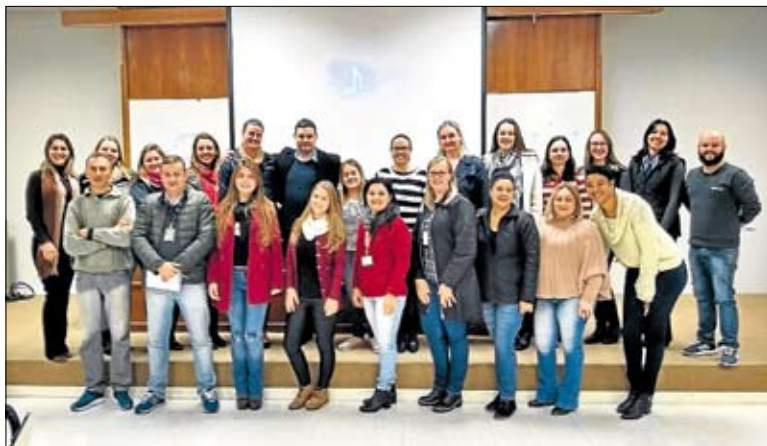
Foco esteve em buscar a melhor essência de cada ser humano