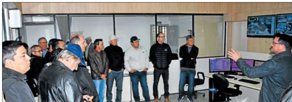
Comitiva também conheceu o Centro de Operação do Sistema Elétrico