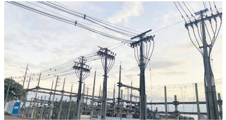
Subestação de Teutônia

Para Diehl, os investimentos estratégicos refletem o compromisso da Cooperativa em fornecer uma energia elétrica confiável, com uma infraestrutura pronta para atender às demandas crescentes de energia. “É muito importante estarmos atentos à expansão do sistema elétrico, com uma visão para o futuro e preparados com soluções bem planejadas”, finaliza.