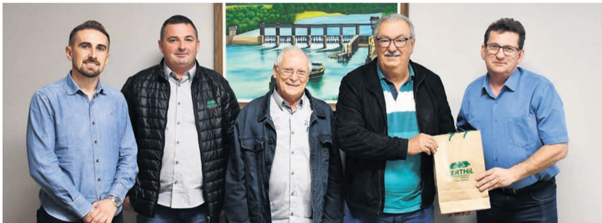
Certhil conheceu estrutura fabril

bém montar uma fábrica especializada na produção de postes e pré-moldados em Três de Maio, atendendo às demandas crescentes do mercado de infraestrutura elétrica.