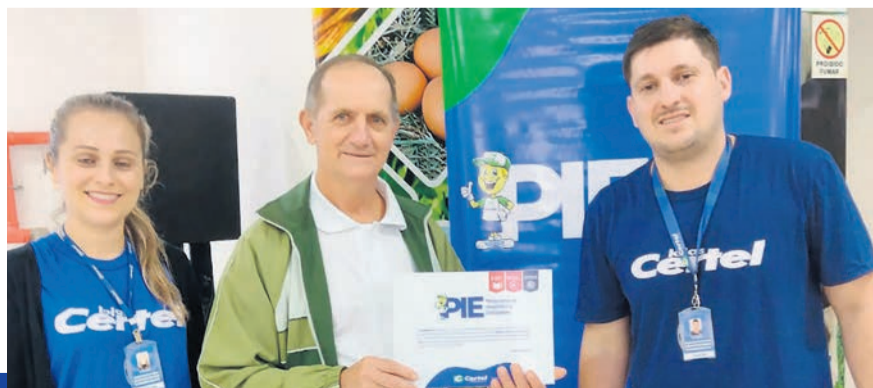
Recebeu R$ 5 mil para inclusão digital de agricultores

“Iniciativas que estimulam a leitura são cada vez mais raras num mundo que é digital. A parceria da Certel nos permitiu adquirir bons livros e incentivar a leitura num espaço adequado, e a conversa com os autores foi bastante construtiva também.”