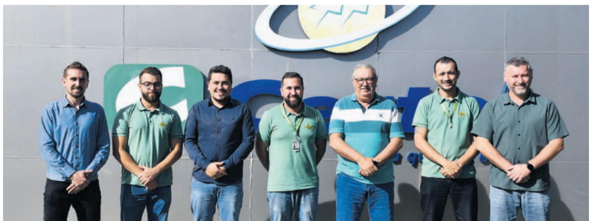
Celetro visitou setores do almoxarifado e compras

A Certhil conheceu a estrutura fabril da fábrica de artefatos, com objetivo de tam-