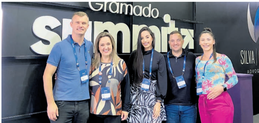
Evento contou com a presença de 10 mil visitantes

Profissionais participaram dos três dias de evento, que contou com muitas experiências nas áreas de marketing, vendas e tecnologia