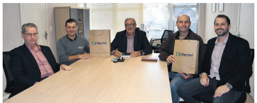
Visita proporcionou uma conversa sobre o cooperativismo e a sua importância