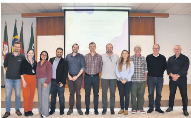
Programa foi criado em 2021 para preservar a Microbacia do Arroio Harmonia