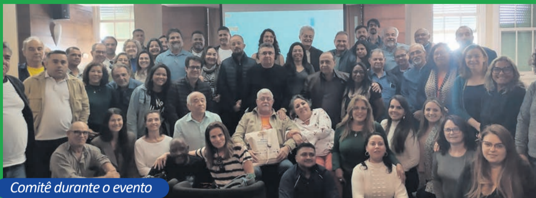
Comitê durante o evento

O Rio Grande do Sul sediou, nos dias 10 e 11 de maio, no Cais Mauá, em Porto Alegre, a 2ª Reunião Ordinária do Fórum Nacional de Comitês de Bacias Hidrográficas (FNCBH) do ano de 2023. O encontro teve como objetivo a troca de experiências com foco na gestão participativa e compartilhada dos componentes do Sistema de Recursos Hídricos do Brasil.