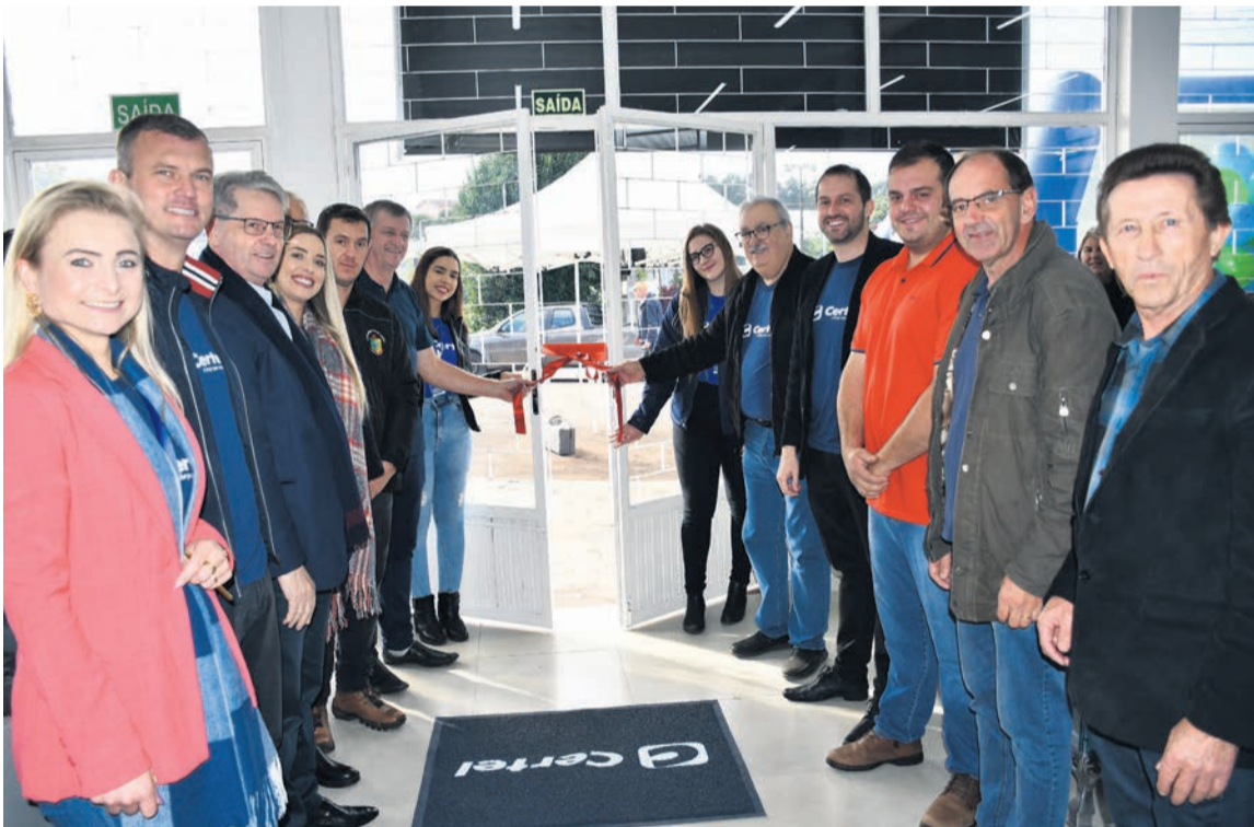
Momento contou com lideranças locais e representantes da Certel. Página 3

Inaugurações foram realizadas no mês passado