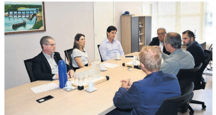
Visita possibilitou a troca de informações e planejamento. Página 4

"Se o consumidor pudesse optar, escolheria a Certel como fornecedora de energia", diz prefeito de Lajeado