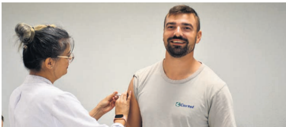
Campanha de vacinação reforça a importância da imunização

A Certel promoveu aos seus funcionários a aplicação de vacinação contra a Gripe Influenza, abrangendo as variantes H1N1, H3N2 e duas variedades do tipo B. Em parceria com o SESI de Porto Alegre, a imunização beneficiou 120 funcionários de diversas áreas da Cooperativa.