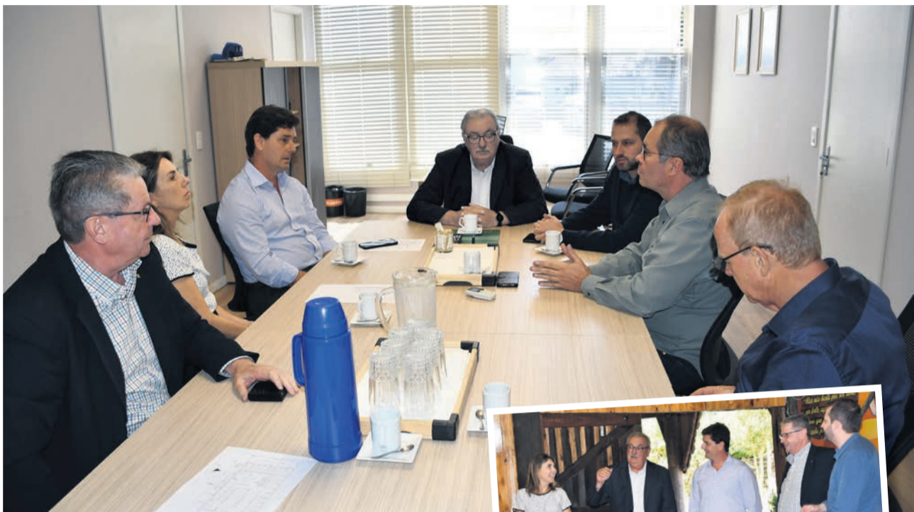
Encontro iniciou na sede administrativa da Certel, em Teutônia