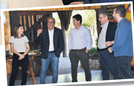
Também conheceram as instalações junto à Associação Atlética da Certel