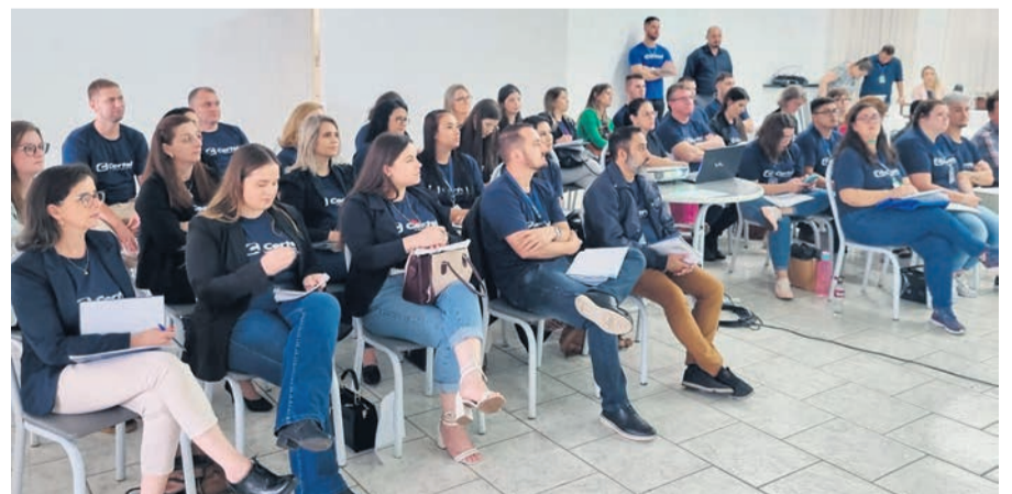
Além dos gerentes, equipes de outros setores participaram

Oportunidade avalia ferramentas e técnicas para a otimização de processos diários