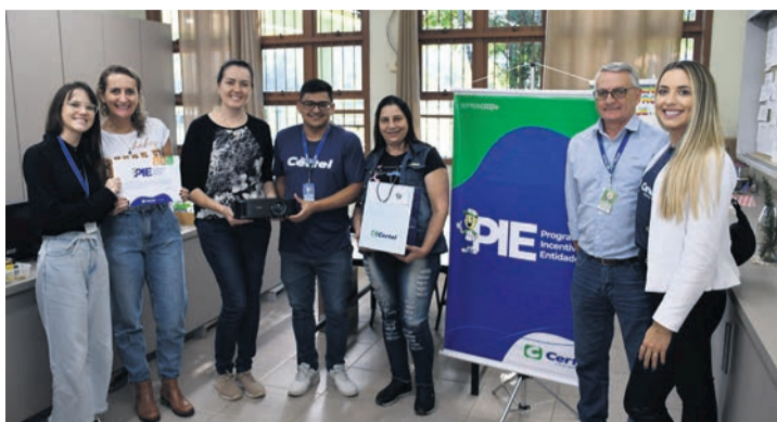
Recebeu um projetor