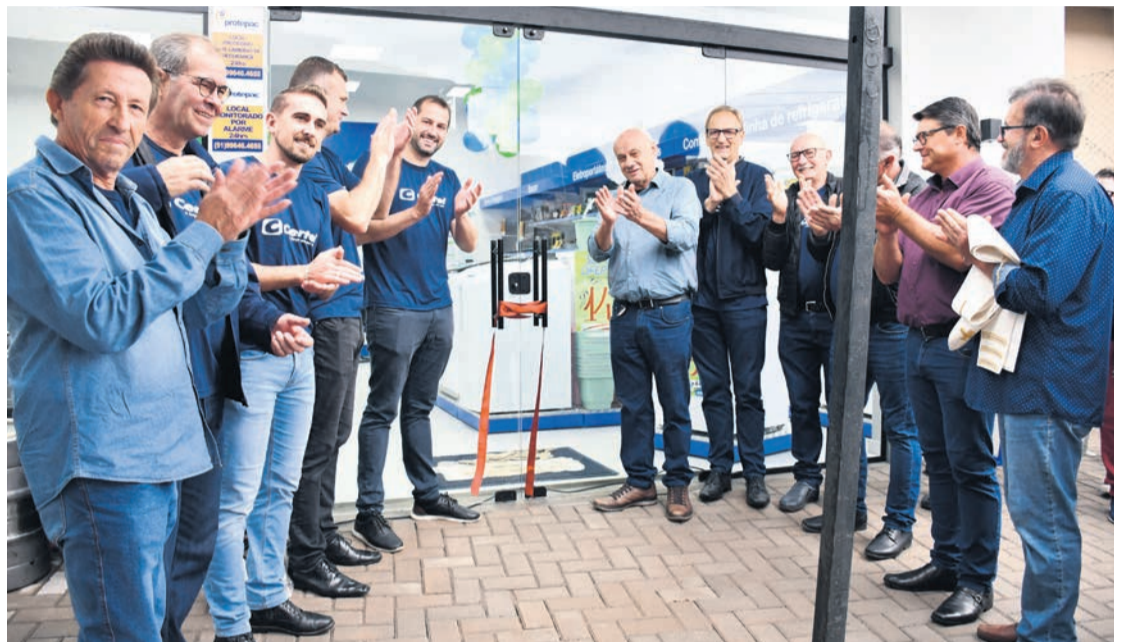
Inauguração em Boa Vista do Sul