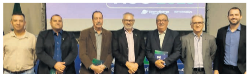
Cooperativas também acompanharam a projeção do RSCOOP150bi

No dia 14 de abril, o Sindicato e Organização das Cooperativas do Estado do Rio Grande do Sul (Ocergs) realizou, no formato presencial, no Hotel Deville em Porto Alegre, a Assembleia Geral Ordinária (AGO), na qual foi aprovada a prestação de contas do exercício de 2022 e estabelecido o plano de trabalho de 2023. As pautas foram aprovadas pelo quórum de 60 cooperativas, que representaram 292 votos.