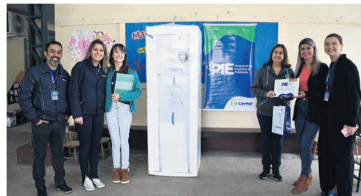
Recebeu uma geladeira