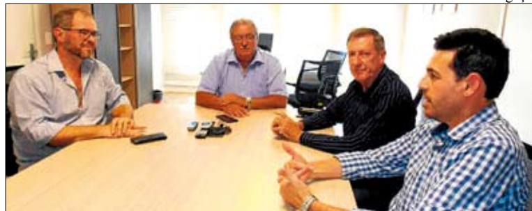
Reunião em Teutônia discutiu ações de interesse mútuo