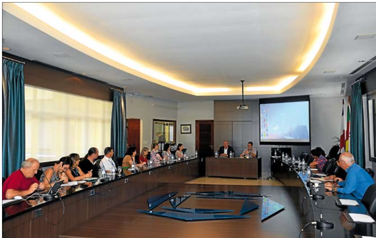
Instituições estudam ações que contribuam com o desenvolvimento do Vale. Página 7