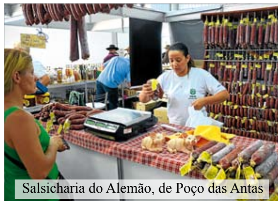
Salsicharia do Alemão, de Poço das Antas

Potencializar o desenvolvimento de municípios com predomínio agrícola e estimular a permanência de jovens no meio rural. Estas são algumas das vantagens oferecidas pelo sistema agroindustrial, que vem mostrando crescente força em nossa região. Prova disso foi a significativa presença de agroindústrias associadas à Certel que expuseram na 19ª Expoagro Afubra, em Rincão Del Rey, Rio Pardo, entre os dias 26 e 28 de março.