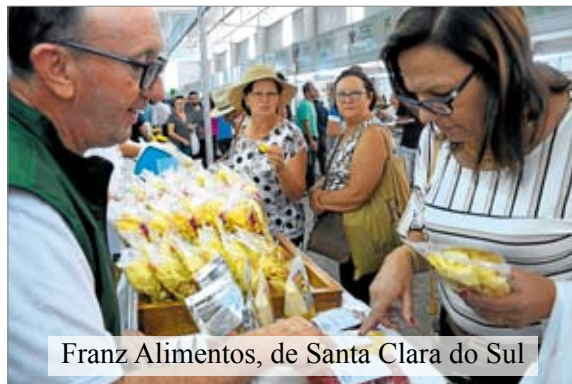
Franz Alimentos, de Santa Clara do Sul