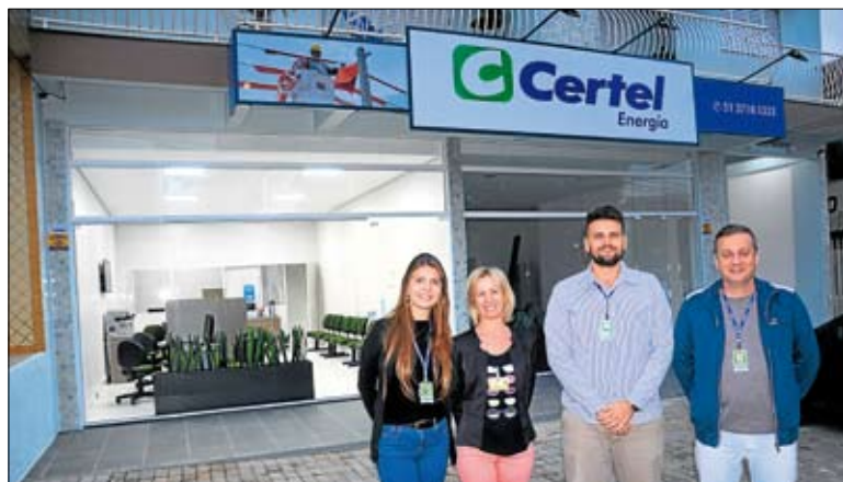
Fica na Avenida Benjamin Constant, 3.533, no Bairro Montanha

Com o objetivo de melhor atender os associados de Lajeado, a Certel está com novo endereço do seu escritório regional de energia. Agora, o atendimento ocorre na Avenida Benjamin Constant, 3.533, junto ao Edifício Três Passos, no Bairro Montanha, próximo ao antigo local.