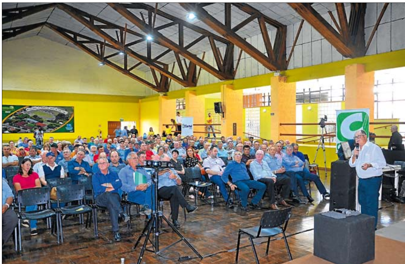
Uma palestra sobre Governança Cooperativa contribuiu com o evento. Página 3