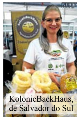
KolonieBackHaus, de Salvador do Sul