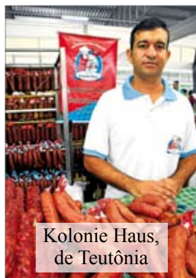
Kolonie Haus, de Teutônia