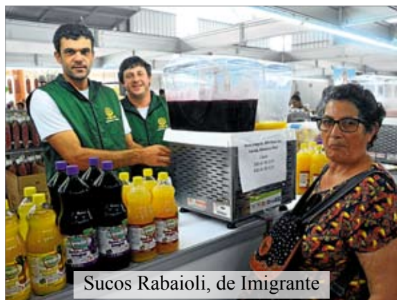
Sucos Rabaioli, de Imigrante