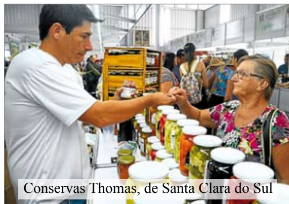
Conservas Thomas, de Santa Clara do Sul