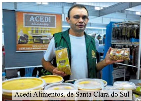
Acedi Alimentos, de Santa Clara do Sul