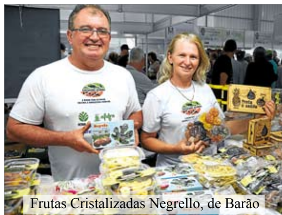
Frutas Cristalizadas Negrello, de Barão