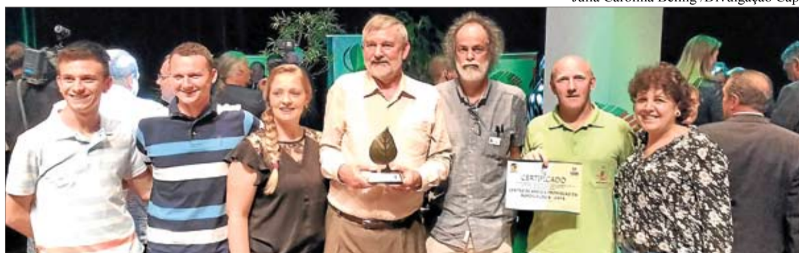
Capa