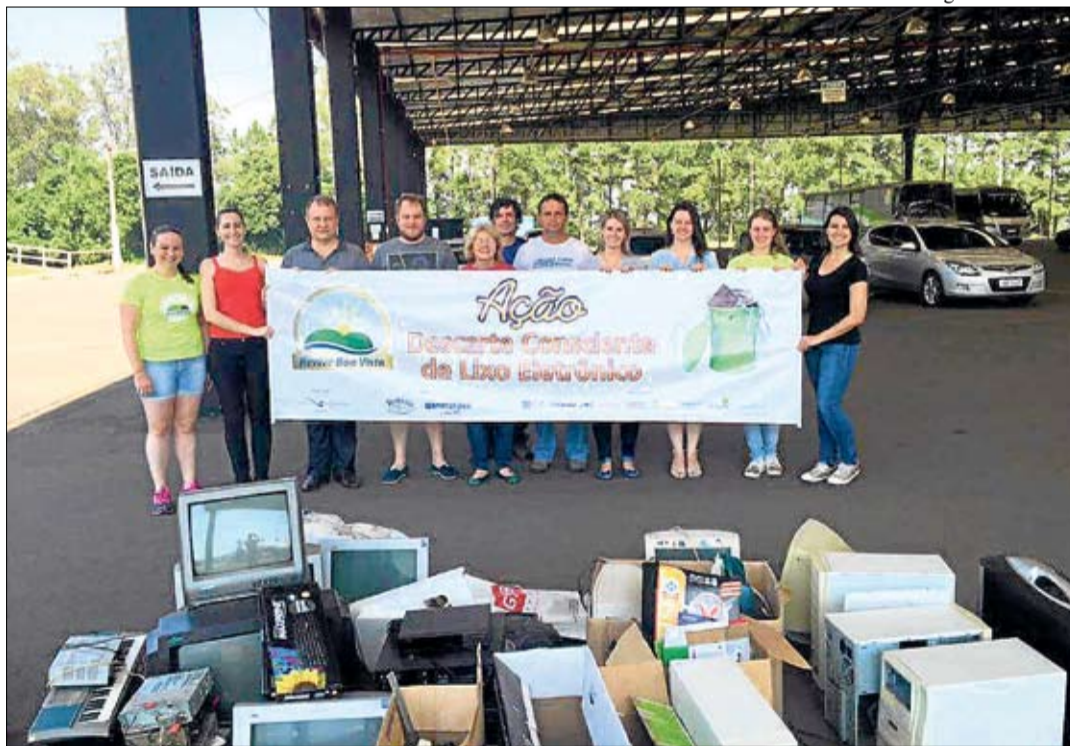
Voluntários receberam materiais em posto de coletas instalado na Prefeitura de Teutônia

No dia 26 de novembro ocorreu edição especial de descarte consciente de lixo eletrônico e medicamentos vencidos, iniciativa que integrou a programação do 7º Revive Boa Vista, ação socioambiental teutoniense que objetiva a preservação do Meio Ambiente e a conscientização da população para cuidados com a natureza e a correta destinação do lixo.