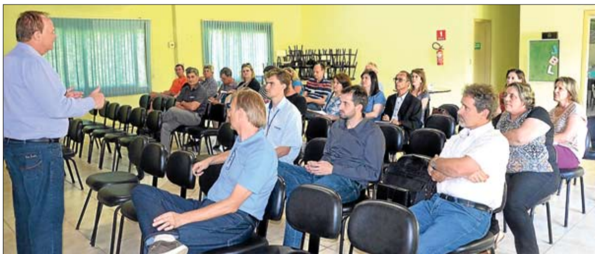
Reunião realizada no Jardim Botânico, em Lajeado