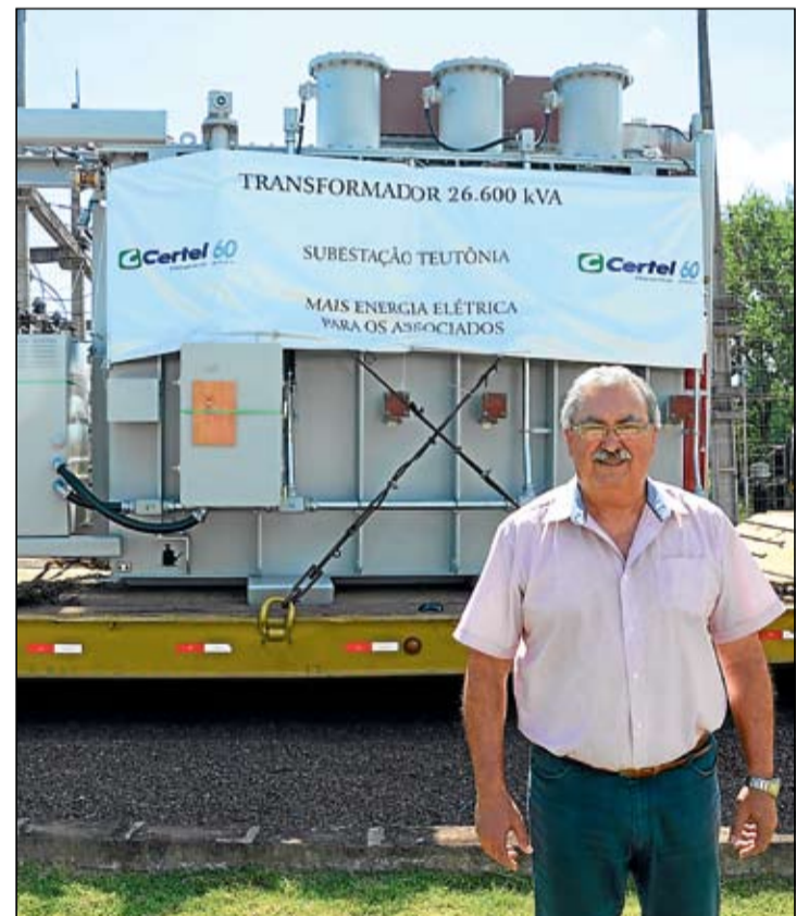
Presidente junto ao transformador da Subestação de Teutônia

cada vez mais confiável. “Trata-se de um insumo que, tanto nas áreas rurais quanto nas urbanas, está cada vez mais presente em nossas vidas. Oferecemos uma estrutura moderna que garante um fornecimento qualitativo e confiável, com a energia mais barata do País, e seguiremos sempre com esta missão de garantir a qualidade de vida dos nossos associados. A aquisição dos transformadores se soma à cuidadosa manutenção nas linhas de transmissão, no posteamento de concreto, nas subestações rebaixadoras e no atendimento direto aos associados, seja pelos plantões, técnicos e engenheiros ou pelo serviço de teleatendimento, através do telefone gratuito 0800 516300. É um presente de Natal ao quadro social, principalmente considerando-se o início do verão, estação do ano em que o consumo de energia se eleva substancialmente”, enaltece.