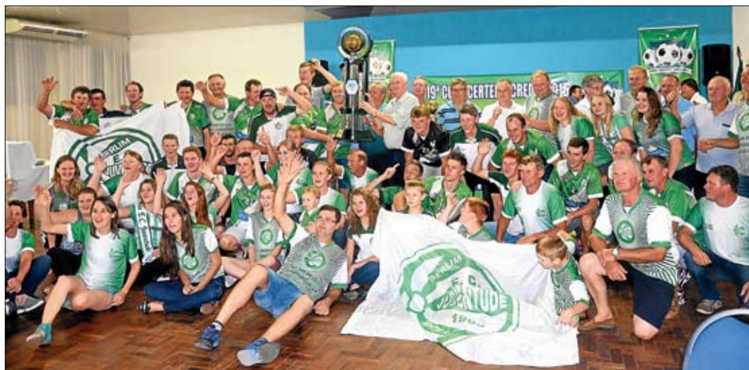
Entrega da premiação ao Esporte Clube Juventude de Linha Berlim, Westfália