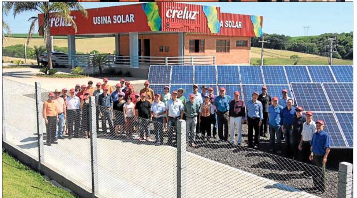
Estruturas foram montadas em Boa Vista das Missões, no Noroeste do estado, pela coirmã Creluz