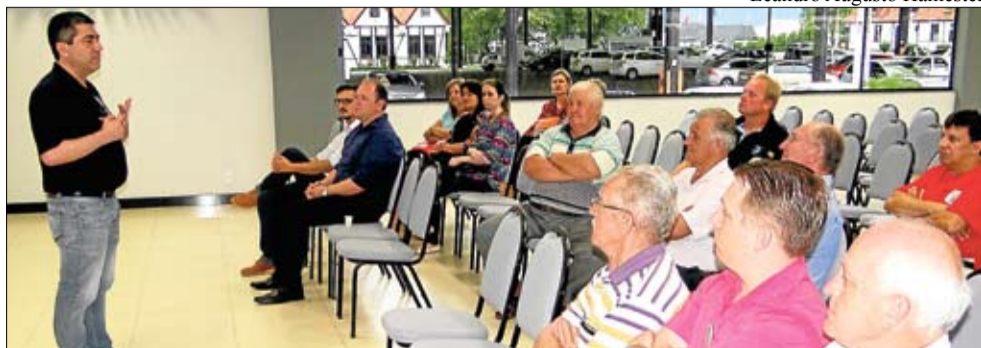
HOB prestou contas do programa Mãos Dadas com a Saúde

Entre novembro e dezembro, a direção do Hospital Ouro Branco (HOB) e os diretores da mantenedora Associação Beneficente Ouro Branco (ABOB) organizaram reuniões com os prefeitos, vereadores, secretários municipais de Saúde e representantes de entidades para prestação de contas do programa Mãos Dadas com a Saúde, iniciativa da Certel, com a parceria das prefeituras de Teutônia, Westfália, Poço das Antas, Paverama, Imigrante e Boa Vista do Sul, em benefício do HOB. As reuniões, que integram o projeto “HOB aberto à comunidade”, também buscaram aproximação da casa de saúde com Executivo e Legislativo de municípios da microrregião atendida pelo HOB, oportunidade para apresentação da situação do hospital e serviços prestados.