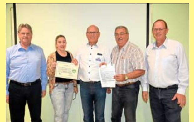
Certificação da Poolseg. Página 7

Poolseg e Sicredi Ouro Branco renovam neutralização de gases poluentes