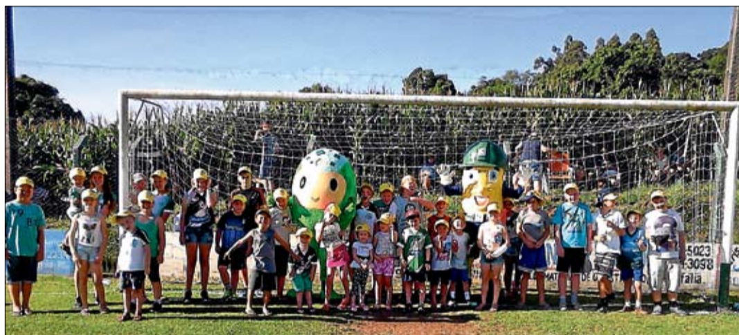
Na final entre Juventude e São Cristóvão, mascotes interagiram com as crianças

Na categoria titulares, foram disputadas 135 partidas e marcados 380 gols, com uma média de 2,81 gols por partida. Na categoria aspirantes, também 135 jogos, 435 gols marcados e uma média de 3,22 por partida. Na veteranos, foram 54 partidas, 176 gols marcados e média de 3,26 por partida.