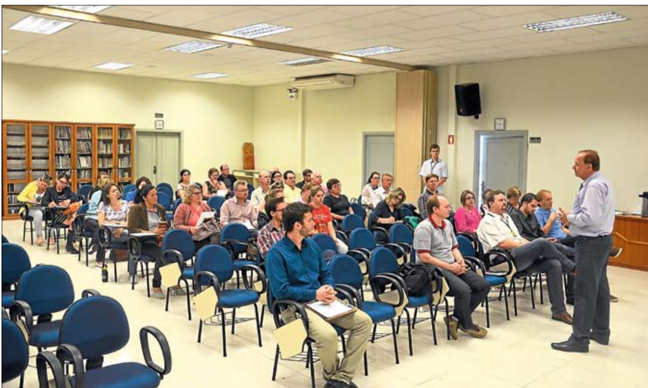
Reunião com representantes de entidades na sede da cooperativa. Página 6

Cooperativa incentiva os ensinos técnico e superior para associados e dependentes