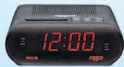
RÁDIO RELÓGIO 382352