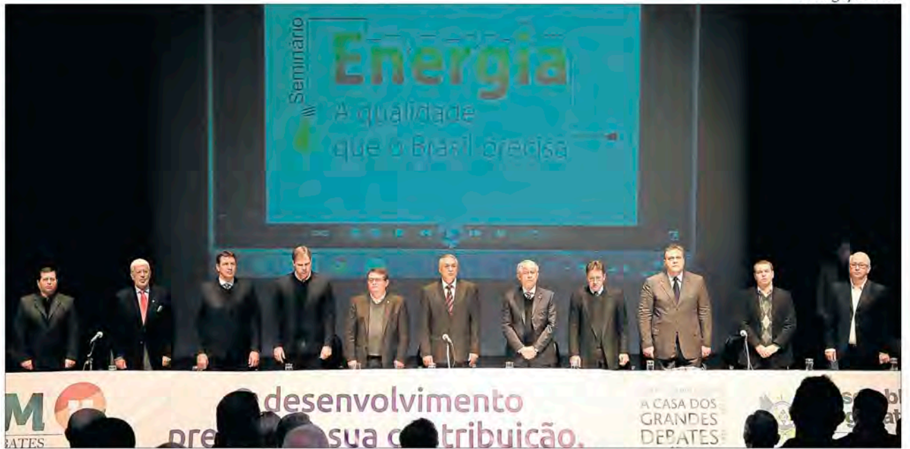
Evento debateu alternativas para ampliação e qualificação da rede elétrica para o meio rural