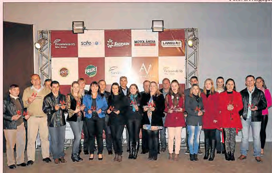
Ganhadores de Canudos do Vale, Sério, Progresso e Boqueirão do Leão

A Loja Certel de Progresso esteve entre as empresas premiadas pelo projeto Atitudes Vencedoras 2015, desenvolvido pelo Sindilojas Vale do Taquari. A cerimônia ocorreu em Canudos do Vale, no dia 9 de julho, e também contemplou outras empresas da região.