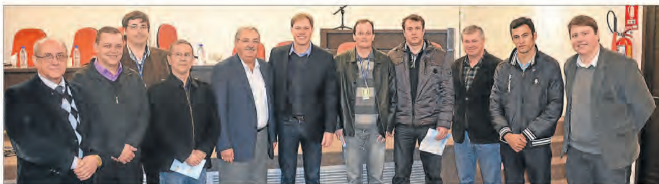
Redecker (c) e colegas de secretaria com equipe da Certel Energia e vereadores de Teutônia

A décima terceira reunião do Plano Energético do RS foi realizada dia 2 de julho, na Univates, em Lajeado. No encontro, o secretário de Minas e Energia, Lucas Redecker, explicou que o objetivo das reuniões é elaborar o planejamento no setor energético. “Queremos planejar o futuro para os próximos dez anos, de acordo com as necessidades de cada região. O Vale do Taquari tem grande potencial para geração de energia, seja biomassa, pequenas centrais hidrelétricas (PCHs) ou energia solar. A região pode chegar ao ponto de produzir além da demanda que necessita.”