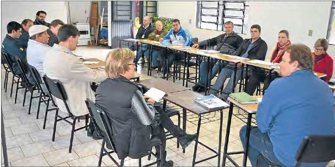
Comissão organizadora tem se reunido mensalmente

Uma das novidades da 9ª edição do Fórum Tecnológico do Leite, evento que ocorre entre os dias 16 e 18 de setembro e é organizado pelo Colégio Teutônia e parceiros, será a Escolinha do Leite, que conta com o apoio da Cooperativa Languiru. Trata-se de uma demanda que surgiu nas edições anteriores do Fórum e busca estimular o consumo de leite a partir das crianças, por meio de um bate-papo direcionado.