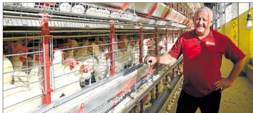
Granja conta com mais de 20 aviários e 500 mil aves