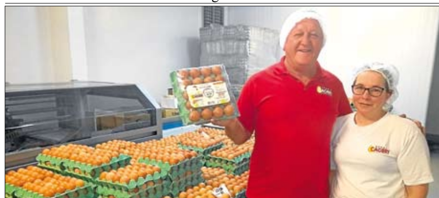
Granja oferece bandeja com capacidade para 20 ovos