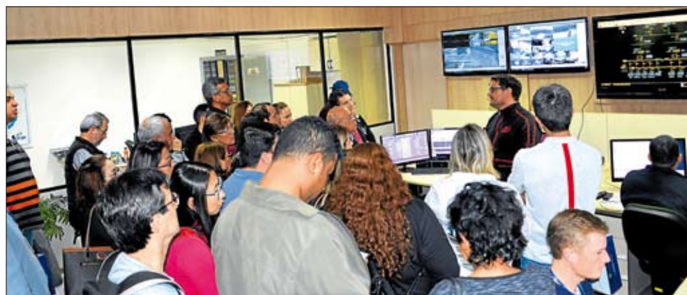
Paraenses conheceram o Centro de Operação do Sistema Elétrico

A Certel recebeu, no dia 28 de maio, a visita da turma de Especialização em Gestão de Cooperativas de Belém do Pará. Promovido pela Faculdade Integrada de Taquara (Faccat), em parceria com a OCB/PA, a especialização reúne profissionais de diferentes ramos do cooperativismo. Além da Certel, também visitaram outras cooperativas gaúchas, como Unimed, Aurora, Sicredi e Languiru.