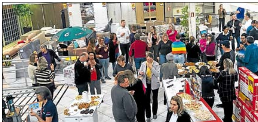
Clientes dos bairros Teutônia e Canabarro foram os beneficiados

As Lojas Certel realizaram, no dia 27 de maio, assembleia festiva do consórcio para as lojas de Teutônia e Westfália. Estiveram presentes associados, clientes e colaboradores das quatro lojas, que prestigiaram o sorteio e aproveitaram o momento para se integrar e conhecer melhor as vantagens das Lojas Certel.