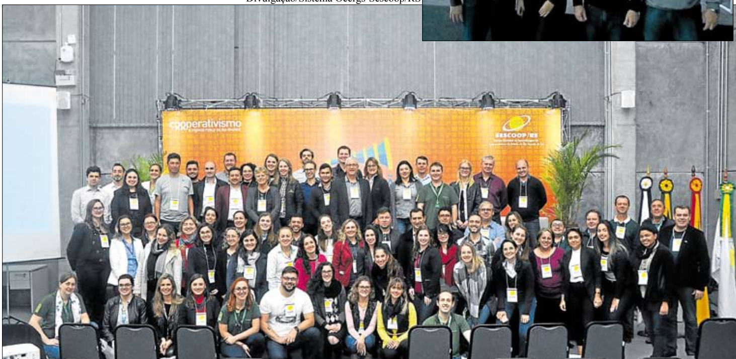
Comunicadores buscam aperfeiçoar o diálogo entre as cooperativas e a sociedade