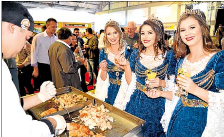
Tradicional evento gastronômico está em sua terceira edição, conta com cardápio e tem programação variada

Uma verdadeira experiência gastronômica, que valoriza a economia e a produção primária de Teutônia, além de incentivar o turismo e oportunizar programação artístico-cultural especial. Essa é a 3ª Teutofrangofest, cujo lançamento oficial da programação e apresentação do cardápio ocorreu na noite de 6 de junho, durante evento no Auditório 3 da CIC Teutônia, com a participação da comissão organizadora, patrocinadores, parceiros, imprensa e convidados.