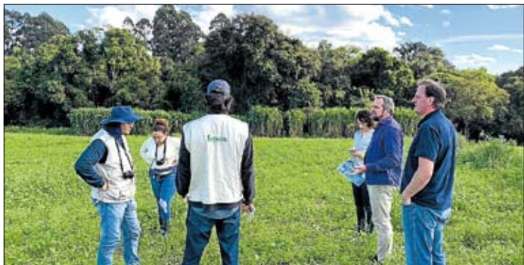
Vistoria integrou o processo de Licença Prévia e de Instalação

Mais um importante passo foi dado em prol da melhoria do fornecimento de energia elétrica para a região. No dia 4 de junho, profissionais da Fundação Estadual de Proteção Ambiental (Fepam) acompanhados de engenheiros da Certel, vistoriaram os trechos que receberão as obras nas linhas de transmissão da cooperativa. A vistoria compreendeu as Linhas de Transmissão Lajeado 03 - Certel 01 e Lajeado 03 - Certel 02.