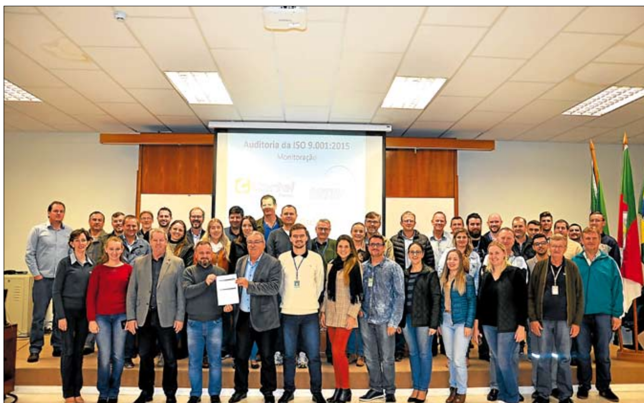
Auditor destacou importância deste primeiro ciclo aos colaboradores. Página 3

Associados estão cada vez mais próximos da Certel