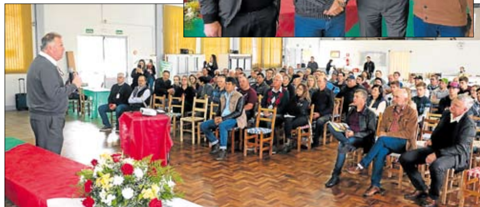
“Um setor primário sem agricultura familiar é como uma cidade sem micro ou pequenas empresas”, comparou o palestrante