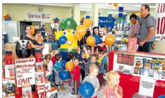
Santa Clara do Sul

A Invasão Certel tomou conta recentemente de dois queridos municípios da região. No dia 21 de junho, por ocasião dos 18 anos da Loja Certel de Marques de Souza, e, no dia 12 de julho, no 26º aniversário da Loja Certel de Santa Clara do Sul.