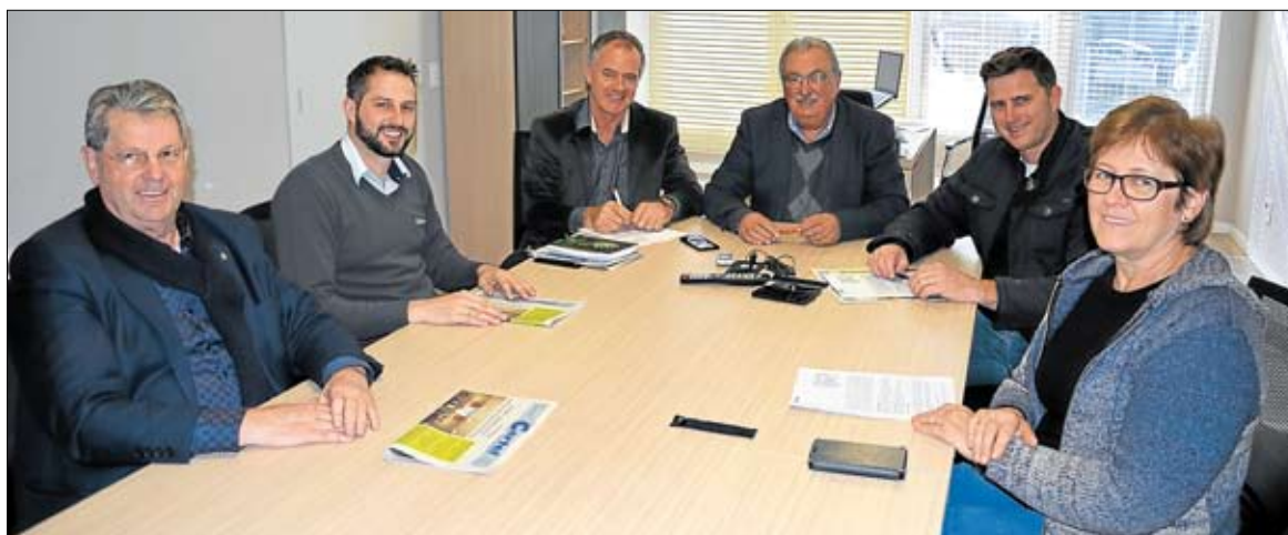
Sindicatos rurais já receberam mais de 264 mil mudas de árvores doadas pela cooperativa

“Cooperativas como a Certel são muito importantes, pois estão em nosso meio, junto às