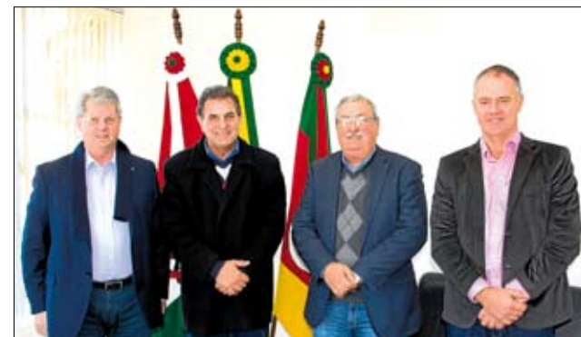
Santa Clara do Sul