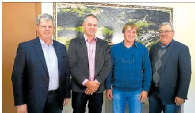
Canudos do Vale