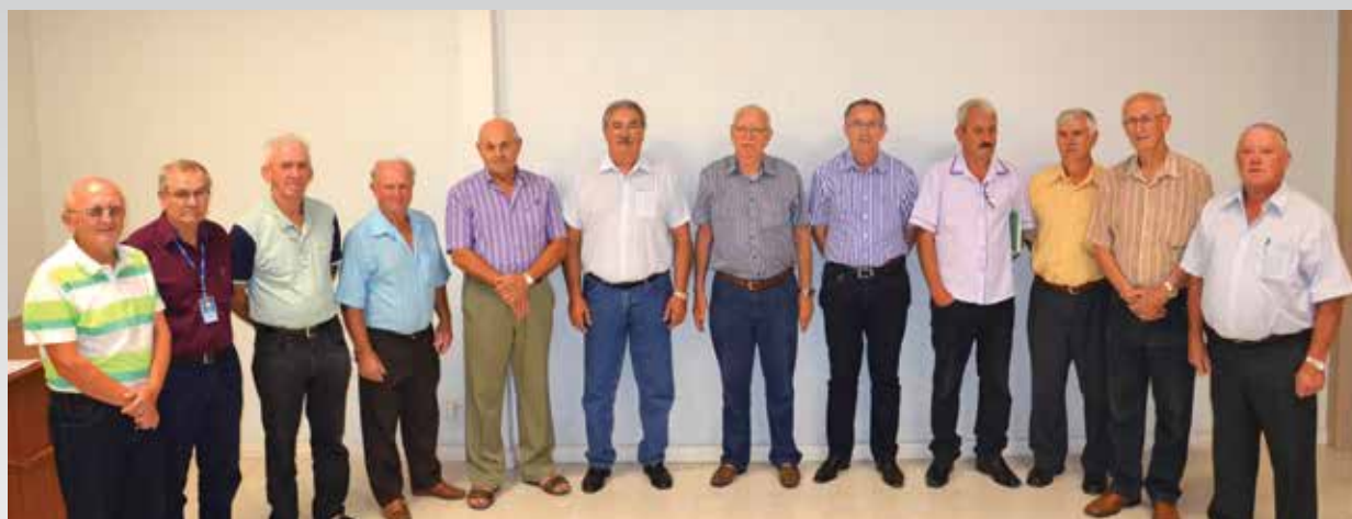
Conselho de Administração