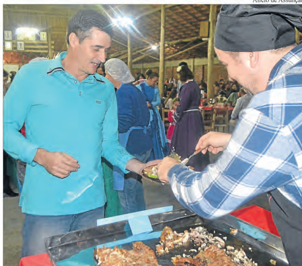
Iniciativa estimula aquecimento do mercado de peixe e alimentação saudável

Além disso, a parceria com a entidade tradicionalista fortaleceu a credibilidade da instituição. Para a Emater, conforme Cardoso, fica a alegria de ver como a sociedade acredita e confia no trabalho da instituição. “A patronagem do CTG Caminhos da Serra abraçou o evento com muita dedicação e seriedade, e a sociedade acreditou nesta parceria entre Emater e CTG, comparecendo em peso para prestigiar e saborear o diferencial do evento.”