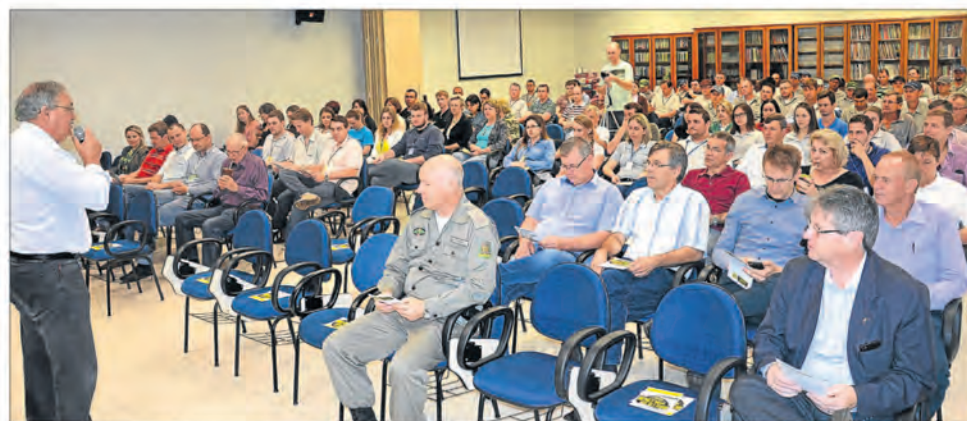
Hennemann destacou os 32 anos de atuação das Cipa's