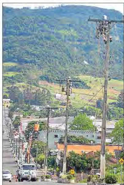
Área urbana de Westfália

A Certel Energia efetuou, entre outubro e novembro, obra de interligação de alimentadores que abastecem as áreas urbanas e rurais de Westfália e Poço das Antas. Para realizar o serviço, foram disponibilizados 40 profissionais, entre equipes de construção de rede, linha viva (rede energizada), projetos, apoio e supervisão. A medida beneficia um total de 2.016 associados consumidores.