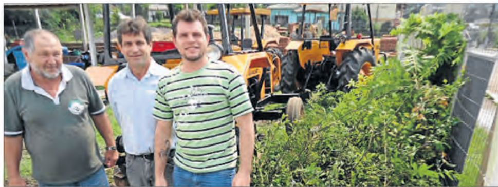
Entrega de mudas em Boqueirão do Leão