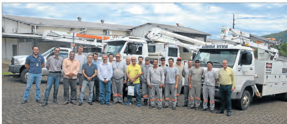
Profissionais que atuam em rede energizada tiveram curso de reciclagem