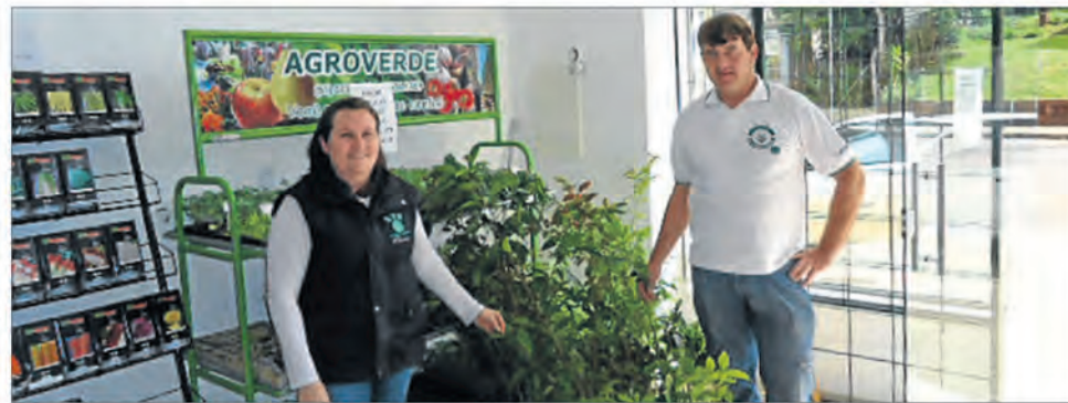
Mudas entregues no Bairro Canabarro, em Teutônia

A Certel Energia estabeleceu convênio com a Associação dos Sindicatos dos Trabalhadores Rurais da Regional Sindical do Vale do Taquari, que objetiva o melhoramento ambiental em propriedades de produtores rurais, nas áreas de degradação ambiental ou de preservação ambiental através do Projeto de Fomento