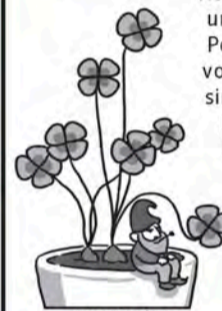
ILUSTRAÇÃO: MÔNICA LIE

Todo mundo já ouviu falar que o TREVO de quatro FOLHAS traz boa SORTE . Mas você sabe por quê? Para início de conversa, o trevo – como diz seu nome científico, Trifolium repens – produz geralmente apenas três folhas. Na IRLANDA , elas simbolizavam a Santíssima Trindade e a FORÇA do Cristianismo, enquanto os CELTAS reverenciavam a TRIÁDE “presente, passado e futuro”. Antigamente, encontrar um trevo de QUATRO folhas era muito RARO , algo considerado MÁGICO . O número quatro é avaliado como SOBRENATURAL em algumas culturas, daí sua importância. Em quatro folhas, o trevo pode representar esperança, fé, AMOR e sorte; as quatro FASES da lua; as quatro ESTAÇÕES do ano; ou ÁGUA , terra, FOGO e ar, os quatro ELEMENTOS da natureza. Sem falar que sua FORMA também pode ser vista como a CRUZ , um ÍCONE sagrado. Por tudo isso, o trevo de quatro folhas simboliza um AMULETO , capaz de levar ao seu portador FORTUNA e prosperidade.