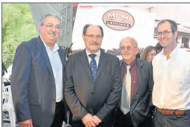
Diretores da Certel também prestigiaram o evento