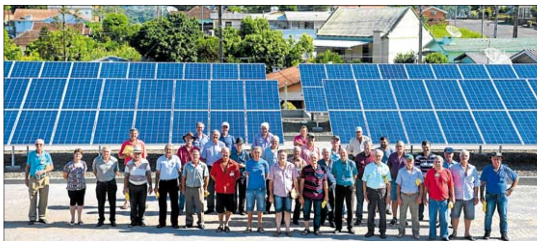
Líderes de núcleo conheceram usina instalada na sede administrativa. Página 3

Mais de 3,2 mil pessoas de diversas localidades participaram da assembleia, realizada no Parque do Imigrante, em Lajeado. Páginas 4 e 5