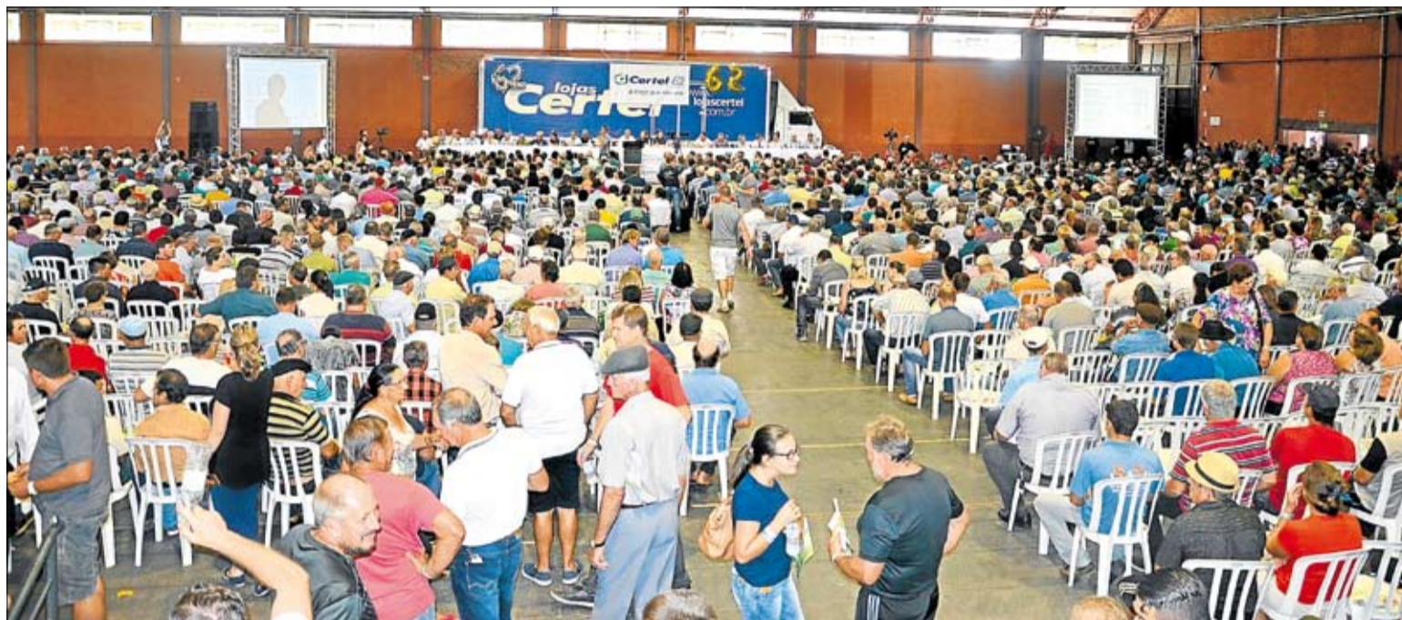
Pavilhão 3 do Parque do Imigrante esteve lotado com associados das diversas localidades atendidas pela cooperativa