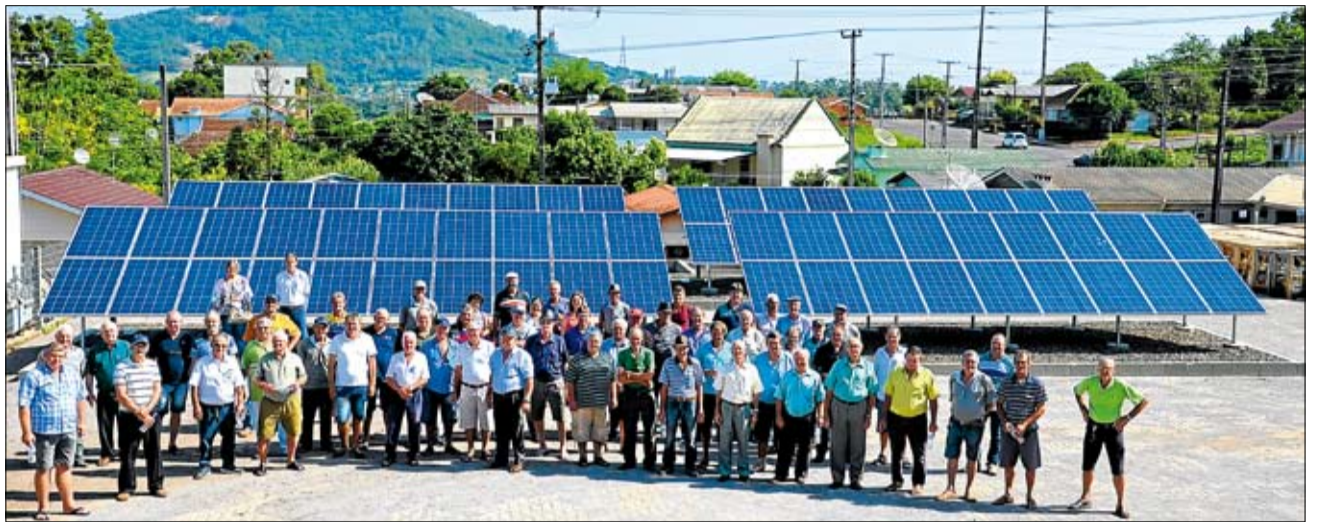
Lançamento do projeto pautou reunião com líderes de núcleo

1. Unidade Individual - O consumidor contrata a