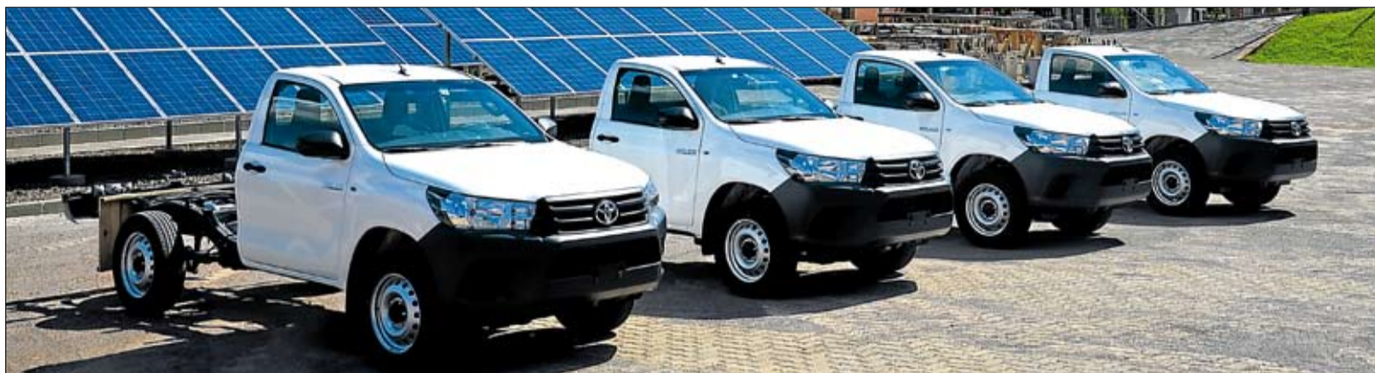
Viaturas contribuirão para um atendimento ainda mais ágil e eficiente aos associados

Esta é mais uma prova do quanto a Certel investe em meios para possibilitar aos associados um atendimento ágil, eficiente e cordial.