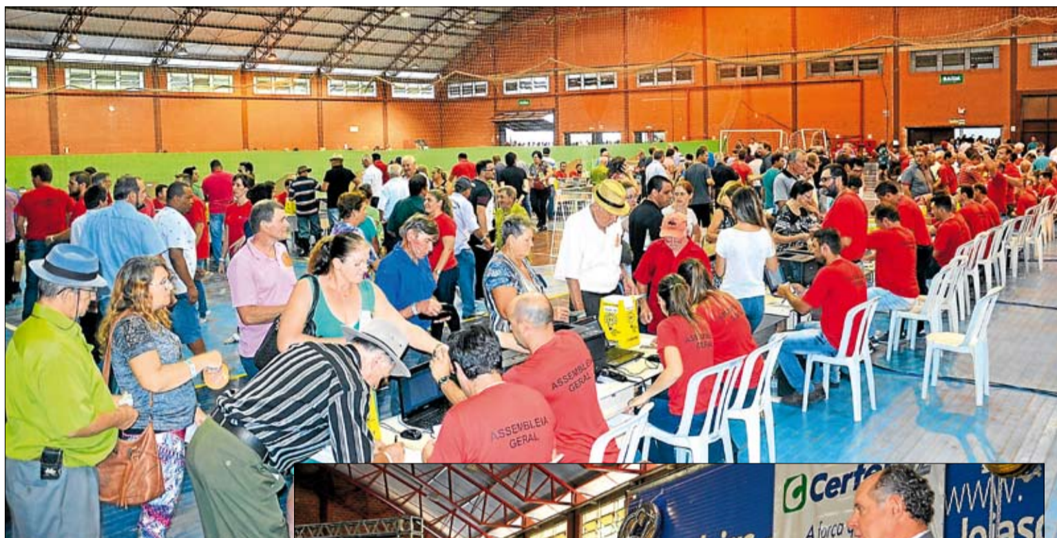
Votações ocorreram no Pavilhão 2 do Parque do Imigrante

Todas as informações do relatório de 2017 já estão disponíveis no site da cooperativa ( www.certel.com.br/publicacoes-legais ) e também constarão na edição de março do Jornal Choque, sendo compartilhadas com todo o quadro social.