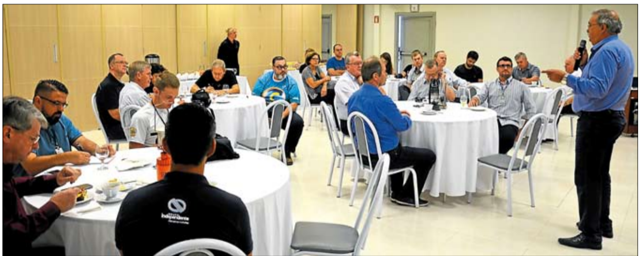
Reunião com a imprensa regional visou disseminar as vantagens da geração fotovoltaica

Certel para a instalação da unidade individual em sua casa ou empresa e financia diretamente com a instituição bancária.