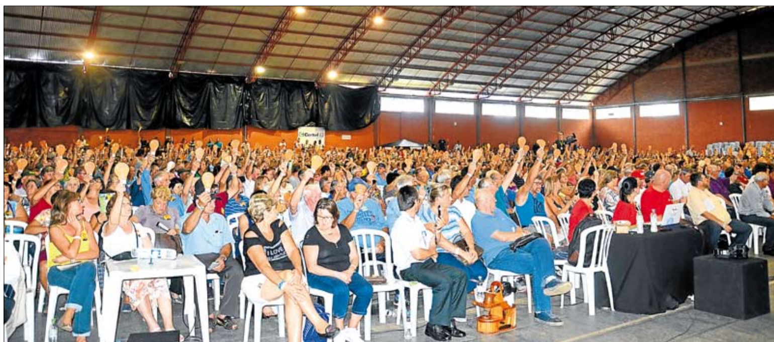
Associados participaram da decisão dos rumos da cooperativa, que se mantém focada em oferecer qualidade no atendimento

Uma assembleia histórica marcou os 62 anos da Certel, celebrados nesta segunda-feira, dia 19 de fevereiro. Mais de 3,2 mil associados, das mais variadas localidades atendidas pela cooperativa, lotaram o Pavilhão 3 do Parque do Imigrante, em Lajeado. Na ocasião, houve apresentação dos resultados de 2017 e eleição dos novos membros dos Conselhos de Administração e Fiscal da Certel Energia. O relatório anual destaca que, em 2017, a cooperativa investiu mais de R$ 28 milhões, dos quais, R$ 9,5 milhões em aquisição e modernização da infraestrutura energética e R$ 19 milhões em manutenção do sistema de distribuição.