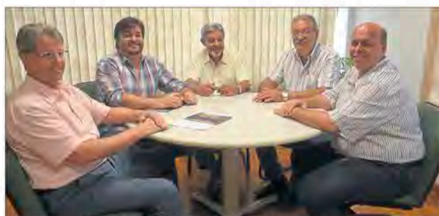
Prefeito de Imigrante, Celso Kaplan