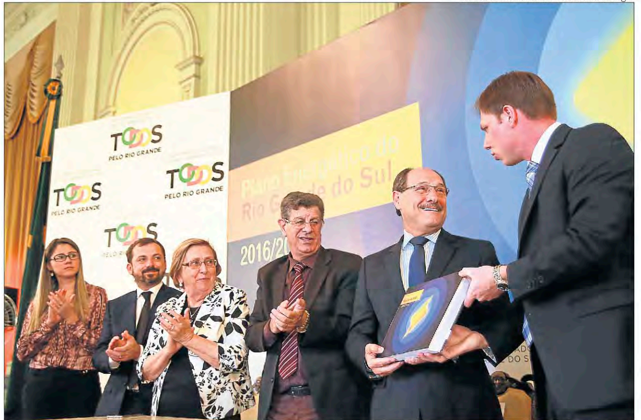
Objetivo é garantir abastecimento com qualidade a todos os gaúchos. Página 6