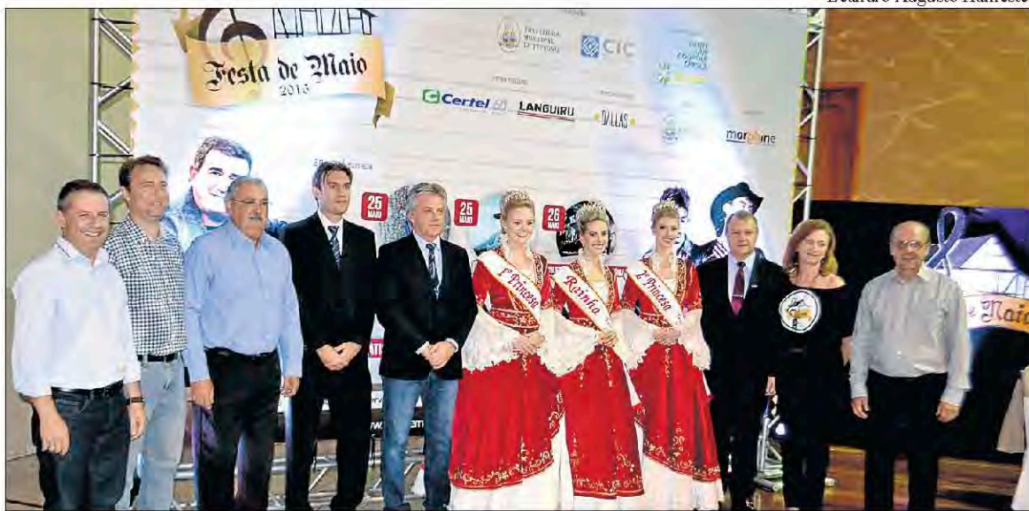
Parceiros, apoiadores e patrocinadores da Festa de Maio 2016

Na noite de 11 de março, a CIC Teutônia e a Prefeitura de Teutônia realizaram evento especial de lançamento da Festa de Maio 2016, programação alusiva ao 35º aniversário do município e que ocorre no período de 25 a 29 de maio. O lançamento aconteceu na Associação Pró-Desenvolvimento de Languiru e contou com apresentação da Orquestra Juvenil de Teutônia, desfile das soberanas com traje oficial, apresentação completa da programação da Festa de Maio 2016, pronunciamentos de autoridades e comissão organizadora, encerrando com coquetel de confraternização.