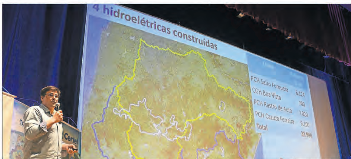
Oportunidades na geração de energia elétrica foram apresentadas pelo engenheiro Hélio Pires