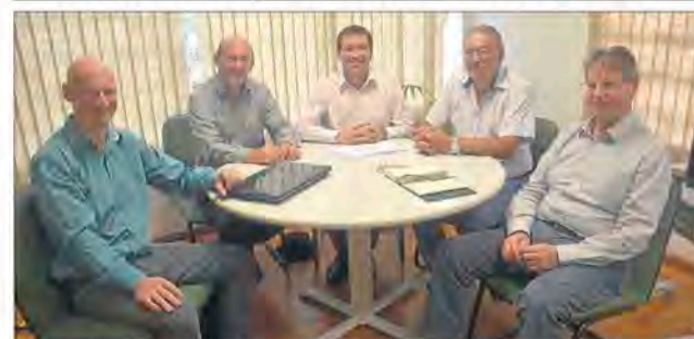
Prefeito de Barão, Jefferson Schuster Born