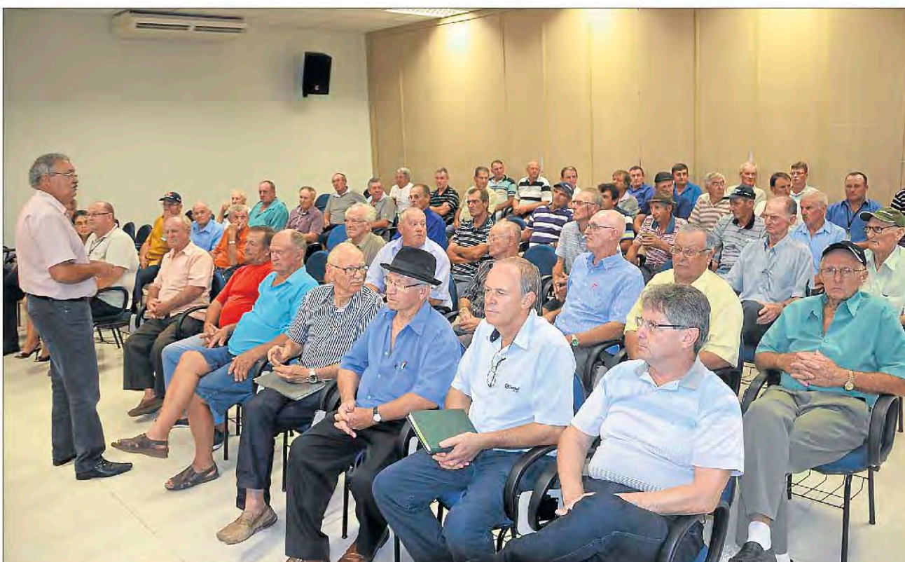
Reunião com líderes da microrregião de Teutônia. Página 3

Certel Energia contempla consumidores do grupo de alta tensão com telemetria