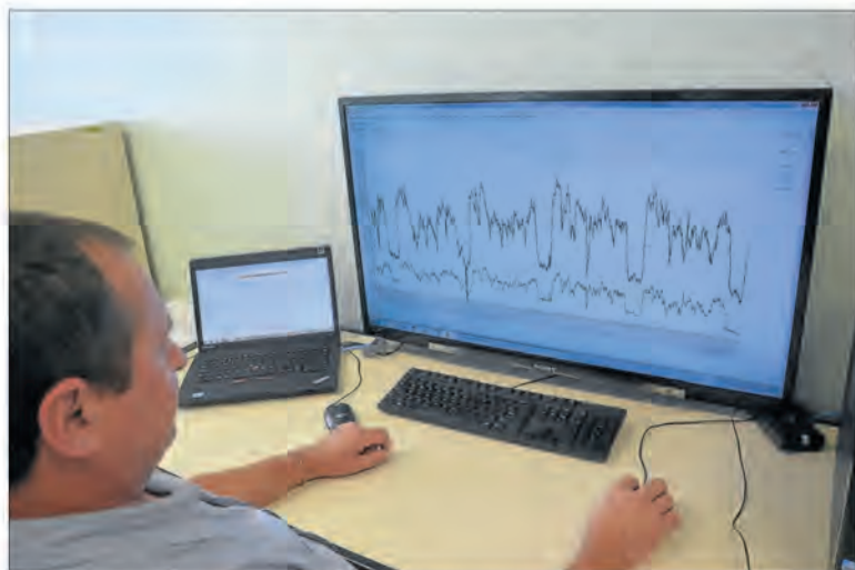
Supervisor observa que grupo A representa mais de 34% do faturamento total

A fim de contribuir com um fornecimento de energia cada vez mais diferenciado, a cooperativa conta com várias equipes especializadas