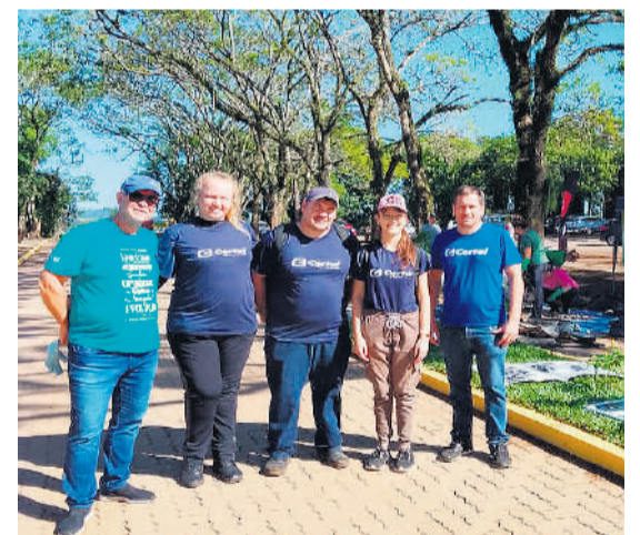
Mais de 4.500 kg de resíduos foram recolhidos

Com apoio de organizações públicas e privadas, voluntários realizaram o recolhimento de resíduos sólidos das margens e do rio Taquari nos municípios de Lajeado, Estrela, Bom Retiro do Sul, Roca Sales e Venâncio Aires. Em Arroio do Meio e Cruzeiro do Sul, a programação teve oficinas ambientais e plantio de árvores, com objetivo de conscientizar os participantes sobre a preservação ambiental. Em Lajeado, foi inaugurado o “Recanto Viva o Taquari-Antas Vivo”, espaço localizado próximo ao parque que vai sediar oficinas e atividades de educação ambiental.