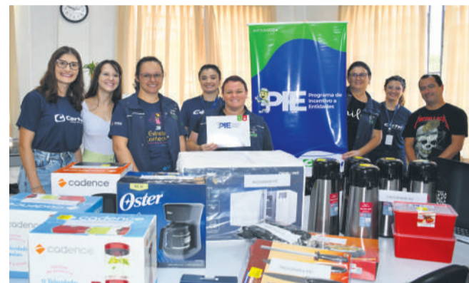
Escola recebeu diversos utensílios

"É uma imensa gratidão receber a Certel em nossa escola para a entrega desses utensílios, que vão proporcionar melhorias em nossa infraestrutura e para atender melhor alunos e professores. Através do Cooperativismo proporcionamos um ambiente mais favorável para a comunidade escolar."