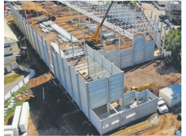
Novo Desco Atacado está em construção

da construção civil em função da qualidade, segurança e agilidade. Contudo, a indústria também está, cada vez mais, presente nas obras da região, fornecendo os demais produtos fabricados, entre eles os tijolos de concreto, blocos, pavimentos e postes. “Nosso último lançamento, o tijolo de concreto leve estrutural, tem tido boa procura. Trabalhadores da construção civil se interessaram nos benefícios e nas possibilidades dessa novidade. De maneira geral, o segmento está crescendo, estamos sendo procurados constantemente para orçamentos e, muito em breve, novas obras começarão, com a qualidade Certel Artefatos de Cimento”, ressalta o gerente.