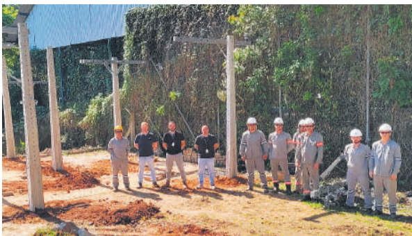
A inauguração está prevista para ocorrer neste mês