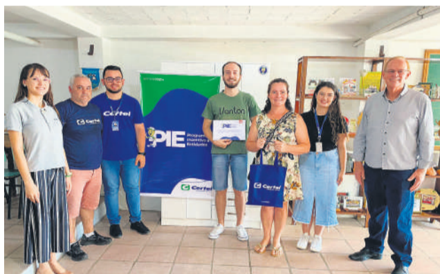
Grupo foi contemplado com um guarda-roupas

"Fomos contemplados com um guarda-roupas, que servirá para o armazenamento dos trajes folclóricos. Esta é uma iniciativa muito louvável. Não se trata de beneficiar apenas os dançarinos e suas famílias, mas de todos que assistem as apresentações. Desejamos vida longa ao PIE."