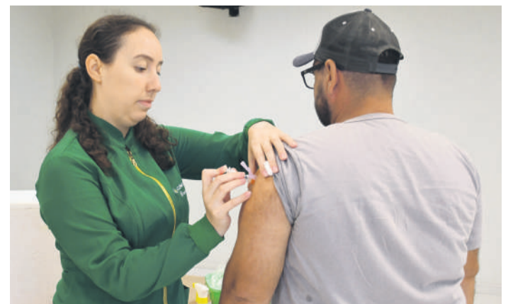
135 doses foram aplicadas

registros de casos graves. A gente sabe que, com o uso de vacinas muitas doenças já foram erradicadas, por isso é muito importante que as pessoas façam todas as vacinas, não só da gripe”, recomenda a enfermeira. Ela ainda explica que a vacina alcança seu pico de ação após 14 dias da aplicação e se mantém por seis meses. Depois, seu efeito reduz gradualmente, por isso é necessário realizar a vacinação todos os anos. Para se vacinar contra a gripe, a partir de seis meses de idade, basta que a pessoa esteja bem de saúde.