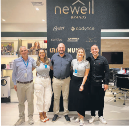
Newell Brands representa grandes marcas