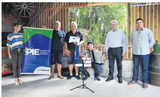
Escola recebeu doação de materiais de construção

"Com esta parceria, fizemos um espaço para vivência multicultural, que mostra as diferentes etnias da nossa comunidade, italianos, alemães, índios, afro, e também a cultura gaúcha, para que o aluno possa ver isso de maneira concreta, não só no livro. Agradecemos ao pontapé inicial que a Certel deu ao nosso projeto."