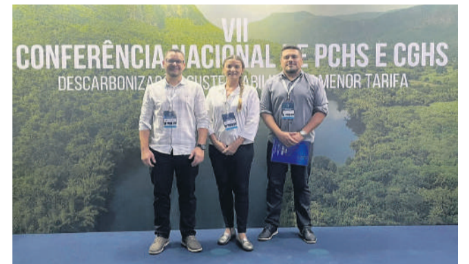
Geração de energia hidrelétrica foi o foco da Conferência