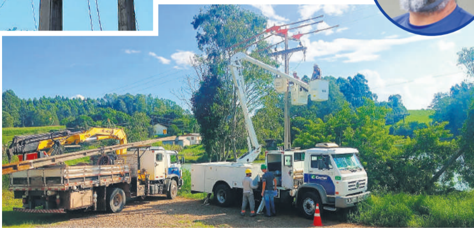
As aulas práticas ocorreram durante as atividades do dia