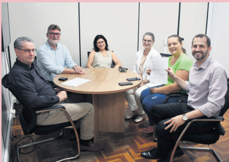
Integrantes do CAPA agradeceram a parceria

A Certel assinou, no mês passado, contrato com o Centro de Apoio e Promoção da Agroecologia (CAPA). Dessa forma, a Cooperativa incentiva as comunidades teutonienses, que são atendidas pela entidade desde 2003. Ela realiza trabalhos de saúde comunitária com diferentes grupos existentes no município, incentivando o hábito da alimentação saudável, a agroecologia, o uso de plantas medicinais e a integração dos participantes, com foco na qualidade de vida das pessoas.