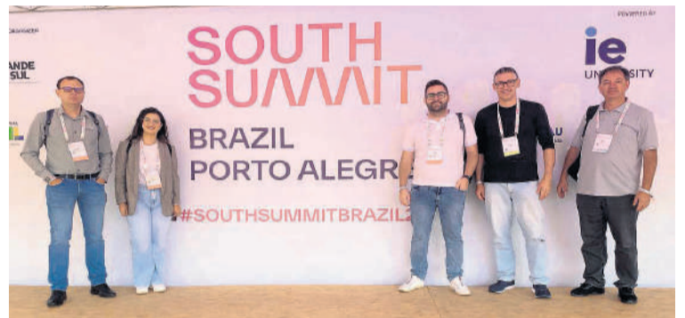
South Summit aconteceu em Porto Alegre

nhecer as tendências que irão nortear, daqui para a frente, a maioria das empresas. Agradeço à Cooperativa pela oportunidade de participar do maior evento de inovação da América Latina, que é o South Summit Brasil. Por se tratar de um evento de tamanha proporção, a Certel não poderia ficar de fora. Afinal, somos uma Cooperativa em constante processo de inovação, em todas as nossas áreas de atuação”, comentou. O South Summit Brasil ocorreu nos dias 20, 21 e 22 de março, no Cais Mauá, em Porto Alegre.