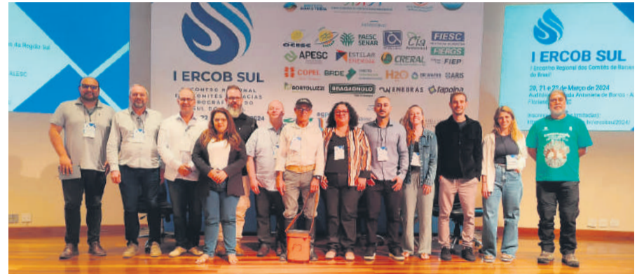
Gaúchos participaram do encontro em Santa Catarina

O 1º Encontro Regional dos Comitês de Bacias Hidrográficas do Sul do Brasil (Ercob Sul) reuniu agentes dos governos e comitês de bacias para discutir temas e capacitações envolvendo recursos hídricos. Durante os dias 20, 21 e 22 de março, em Florianópolis, Santa Catarina, o evento integrou os Fóruns dos Comitês de Bacias Hidrográficas dos três Estados do sul do País para fortalecer a cooperação entre Paraná, Santa Catarina e Rio Grande do Sul.