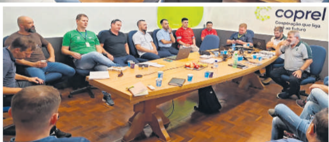
Treinamento contou com aulas teóricas e práticas