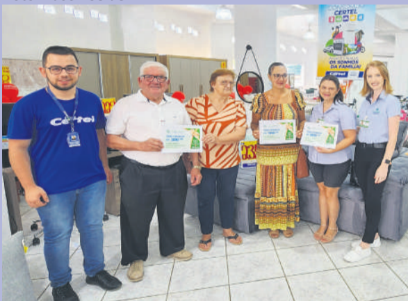
Ganhadores retiraram os prêmios na loja

Associação Hospitalar Marques de Souza realizou o 69º Sorteio da Campanha Mãos Dadas com a Saúde, desenvolvida em parceria com a Cooperativa Certel. Nesta etapa, 682 pessoas doaram através da fatura de energia elétrica.