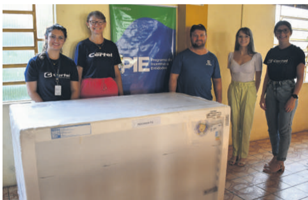
Comunidade recebeu um freezer

"A iniciativa do PIE é muito boa. É uma parceria entre Certel e comunidade. Nossa entidade conta com 680 membros que irão usufruir desse bem. Afinal, realizamos bailes, aniversários e festas em geral. Agradecemos imensamente. É muito bom ser associado da Certel. É uma Cooperativa nota 10."