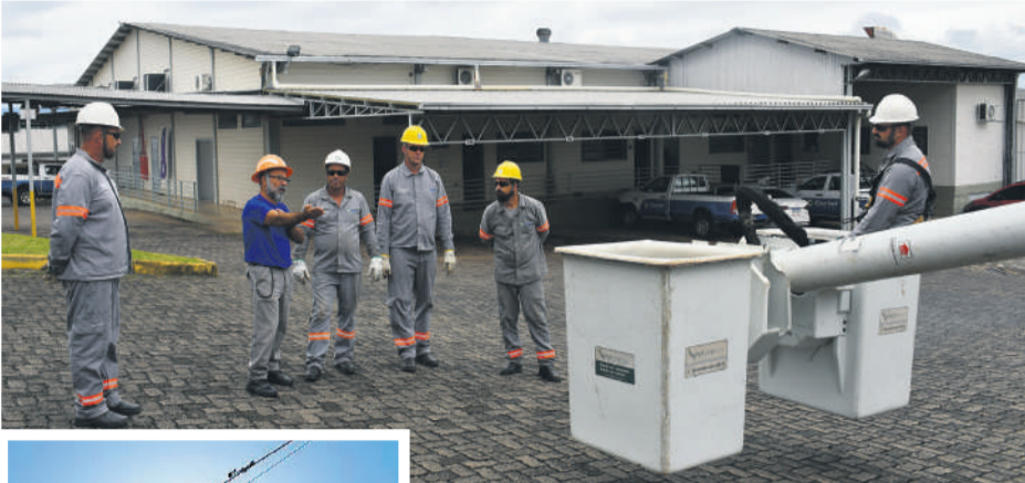
Treinamento contou com simulação de acidentes