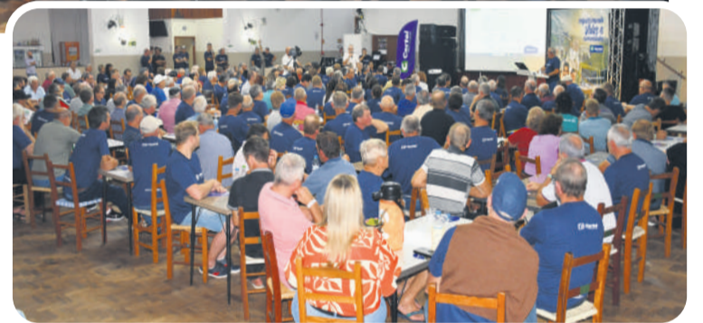
Conselheiros e delegados consolidaram votações

O s delegados e conselheiros administrativos e fiscais participaram, no dia 27 de março, da Assembleia Geral Ordinária (AGO) da Certel, sediada no Grêmio Cultural e Recreativo Teutoniense, em Teutônia. Depois das seis assembleias microrregionais destinadas especialmente aos associados, em Taquara, Salvador do Sul, Boqueirão do Leão, Lajeado, Marques de Souza e Teutônia, a Cooperativa promoveu a AGO para consolidar com os representantes oficiais dos associados tudo que foi debatido e aprovado anteriormente. Além da prestação de contas sobre o exercício de 2023, este processo assemblear também elegeu e empossou novos suplentes de delegados nas microrregiões de Salvador do Sul, Teutônia, Lajeado e Marques de Souza.